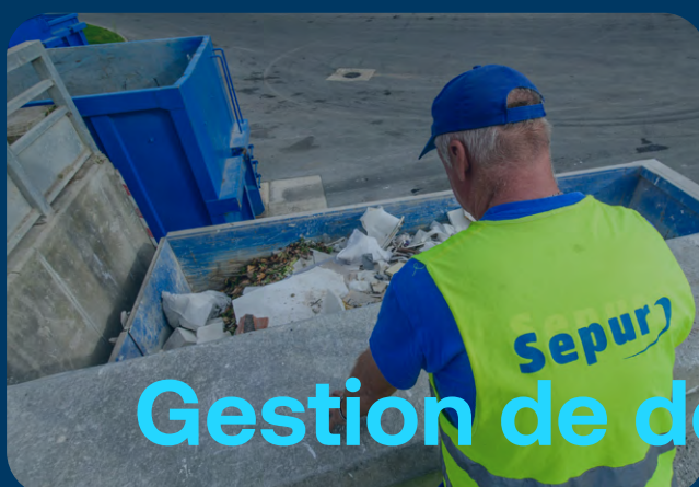
Gestion de déchetterie