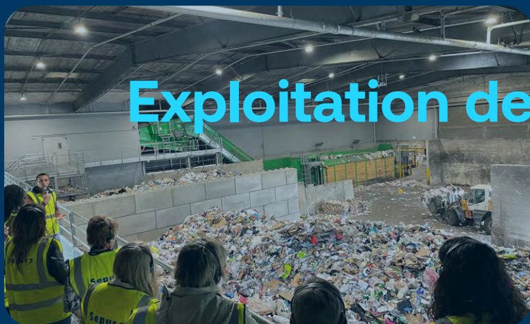
Exploitation de centres de tri