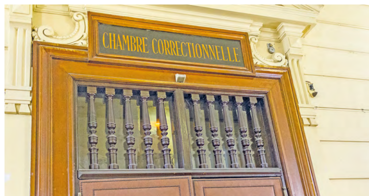
Le tribunal judiciaire de Versailles a condamné, à 30 mois de prison ferme, un homme qui transportait de la drogue.

Un homme et une femme qui circulaient dans une voiture ont été arrêté pour avoir refusé un contrôle. À l'intérieur du véhicule, les policiers ont trouvé une grosse quantité de drogues et de l'argent liquide.