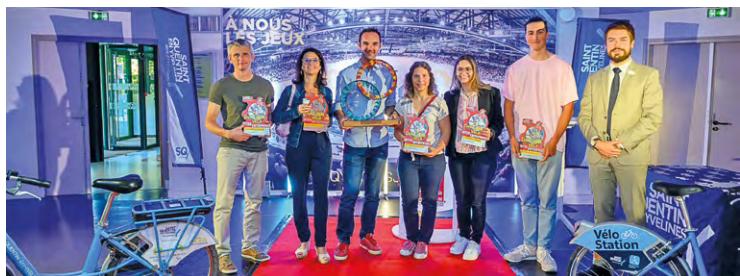
L'année dernière, 44 621 km avaient été parcourus par les vélotaffeurs. La remise des prix s'était déroulée le 5 juillet 2024, en salle du conseil communautaire (photo édition 2024).

Le challenge vélo inter-entreprises revient pour sa 5 e édition à SQY, du 19 mai au 20 juin. Ce défi, gratuit et ouvert à tous, particuliers comme entreprises, permet de promouvoir de manière ludique et durable, l'usage du vélo sur les trajets domicile-travail. Comme l'année dernière, trois épreuves (catégories) sont mises en place. Tout d'abord celle du meilleur cycliste, un challenge individuel basé sur le nombre de trajets. Pour cette épreuve, les cyclistes, ou vélotaffeurs, doivent s'inscrire individuellement. « Les 3 personnes ayant réalisé le plus