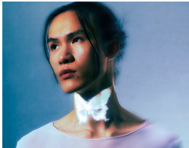
Nuit incolore, qui avait notamment connu le succès avec son titre Dépassé , issu de l'album La loi du papillon , il y a près de 2 ans, sera à la Batterie le 16 mai.

L'artiste suisse, révélé en 2023 avec la chanson Dépassé , se produira à la Batterie le 16 mai.