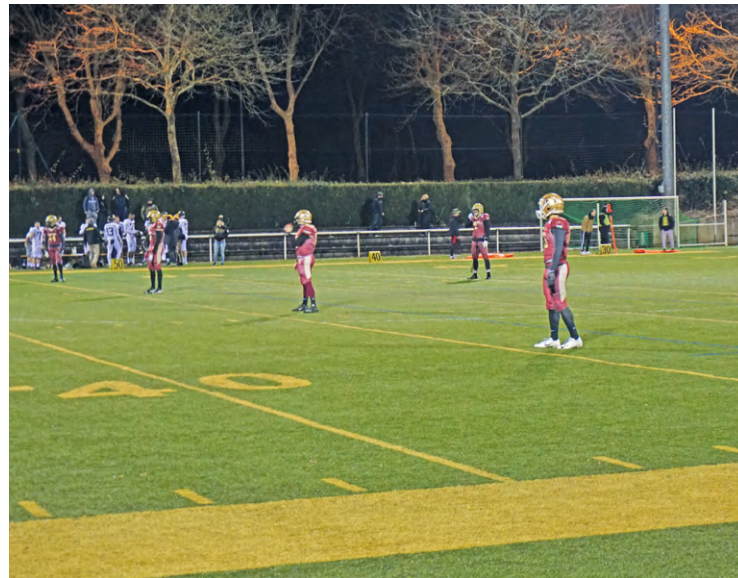
Il fallait terminer à l'une des 2 premières places de la poule pour accéder aux phases finales de conférence. Les Templiers se sont classés 3 es . Leur saison s'arrête donc là.

Le club élancourtois a terminé à la 3 e place de sa poule et n'est donc pas parvenu à se qualifier pour la phase finale du championnat de France de D2.