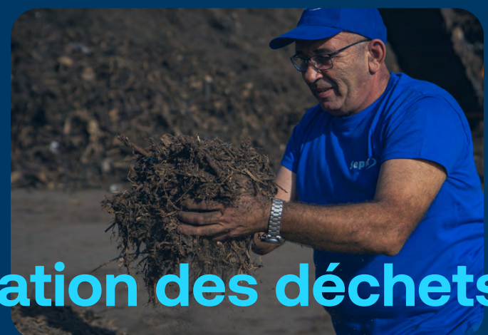
Valorisation des déchets