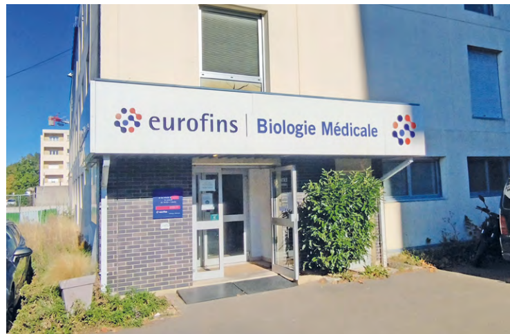
À Maurepas, une IRM et un scanner ont intégré le centre médical des Pyramides en 2023. Depuis, la Ville continue d'agir et a notamment voté une aide de 10 000 euros pour faire venir des médecins, en contrepartie d'une installation d'au moins 5 ans.

« Nous sommes en train de terminer une plaquette de communication pour faire connaître le territoire, parce que si on