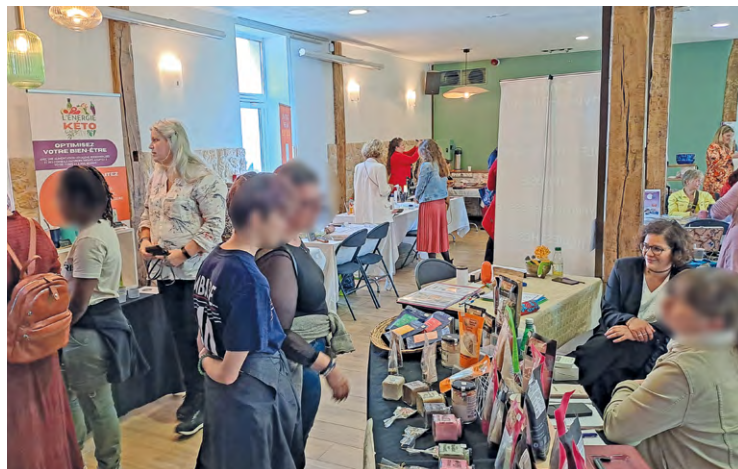
« Plus qu'un salon, c'est une invitation à prendre du temps pour vous, à explorer des pratiques inspirantes et à rencontrer celles et ceux qui pourraient transformer votre quotidien », avancent les organisateurs.

Parmi les spécialités proposées, réflexologie, hypnose, soins énergétiques, naturopathie, massages... « mais aussi des approches pour embellir votre quotidien : créateurs, artistes, home organizer, photographe... Une diversité d'exposants réunis en un seul