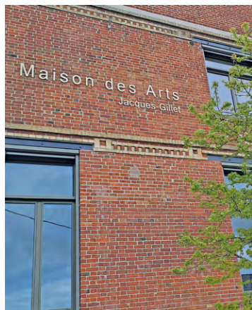
C'est cette fois la Maison des arts Jacques Gillet qui accueillera cet Entr'aidants café, le 14 mai de 10 h à 12 h.

C'est cette fois non plus au gymnase du Jeu de Paume, mais à la Maison des arts Jacques Gillet, au Village, que se déroulera ce futur Entr'aidants café, le 14 mai de 10 à 12 h. Il tournera autour de la question S'investir pour son proche mais