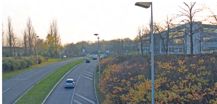
Cet aménagement, censé notamment fluidifier le trafic, est dans les tuyaux depuis plusieurs années mais avait été reporté pour raisons budgétaires, selon la Ville. Sa mise en service est prévue en 2032.

C'est désormais l'échéance de 2032 qui est espérée pour la mise en service de cet échangeur, avec un appel d'offres et un lancement des travaux respectivement en 2028 et 2029. Entre temps, le projet a tout de même connu plusieurs étapes importantes, listées par SQY sur son site