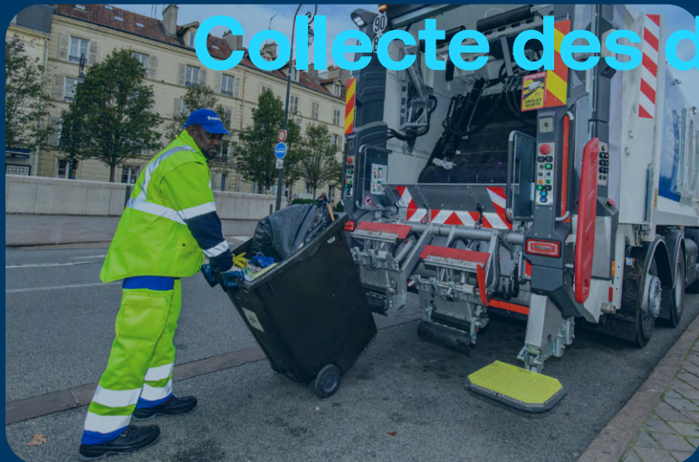
Collecte des déchets