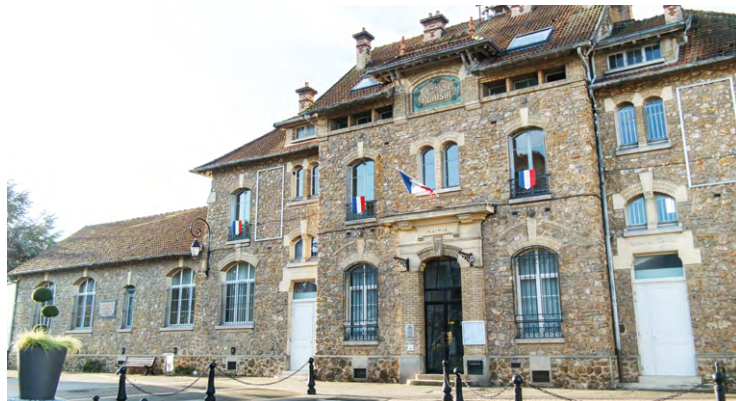
« 196 questionnaires de satisfaction ont été remplis par les habitants présents » lors des 5 réunions de quartiers du mois de mars, résume la Ville.

1 re information d'ordre générale, une note moyenne de satisfaction de 3,5/5 a été attribuée. Les 5 domaines d'actions arrivant en