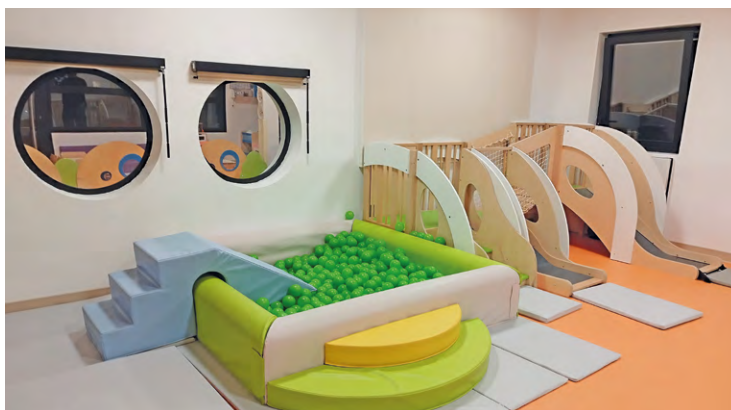
La crèche de Trappes sera dotée d'espaces de motricité (à l'instar d'autres crèches, comme ici les Mini-Montains, à Montigny, inaugurée en novembre dernier).

L'établissement sera inclusif et ouvert à tous, avec des aménagements