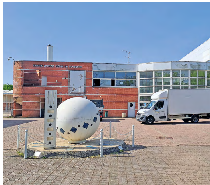
La phase 1 (15 mois) concernera la grande salle et le hall élargi, la phase 2 la salle 2 et la salle de gymnastique (12 mois), et la phase 3 la salle des tennis, pour 3 mois.

Le chantier se déroulera en trois phases et ainsi, les associations pourront « continuer de fonctionner partiellement », affirme l'article du journal municipal. La phase 1 est programmée pour 15 mois. Elle concernera la réfection de la