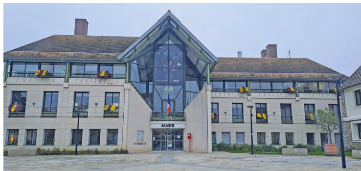
Cette collaboration va se manifester par la tenue d'animations tout public, d'interventions dans les établissements scolaires, de conférences thématiques, ou encore d'ateliers, sur le thème de la lutte contre les fake news.

La ville de Voisins-le-Bretonneux, qui avait déjà consacré un numéro de son magazine municipal à ce thème (lire notre édition du 18 juin 2024), monte une nouvelle fois au front contre ce phénomène, dont elle fait l'un de ses principaux che-