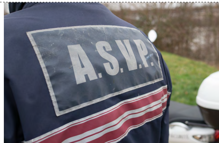
Arrêté par la Police nationale et placé en garde à vue pour avoir insulté deux agents ASVP, à La Verrière.

Loin de se démonter, il va tout d'abord jouer sur la corde sensible