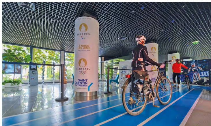
Vélotour est l'occasion pour les participants de découvrir de manière originale des lieux insolites, comme ici avec la traversée de l'hôtel d'agglomération de SQY, situé à Trappes.

La 1 re , celle de 17 km, prendra la direction de France miniature pour offrir aux vélotouristes (le nom donné aux participants) la possibilité de contempler quelques uns des 117 monuments français reproduits et mis en scène dans le parc paysa-