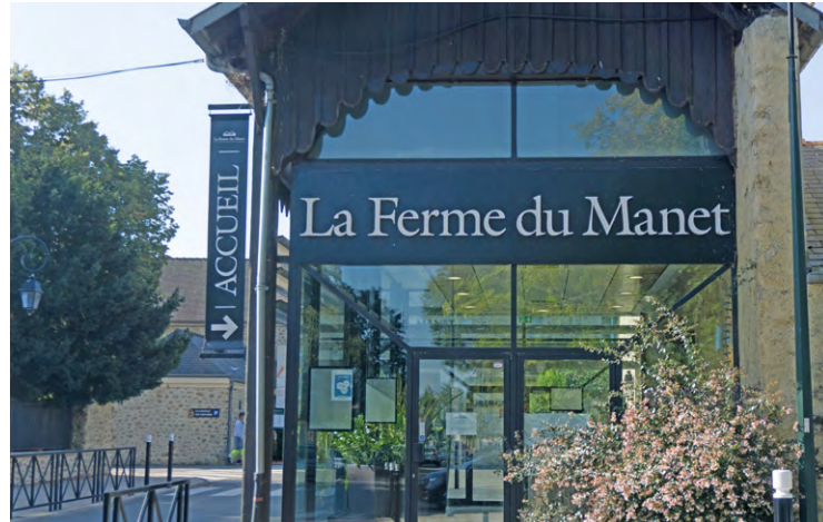
Elena Nagapetyan sera à l'affiche pour la dernière de la saison à la Ferme du Manet.

L'humoriste, avec son style toujours aussi cash, se produira à Montigny le 10 mai.