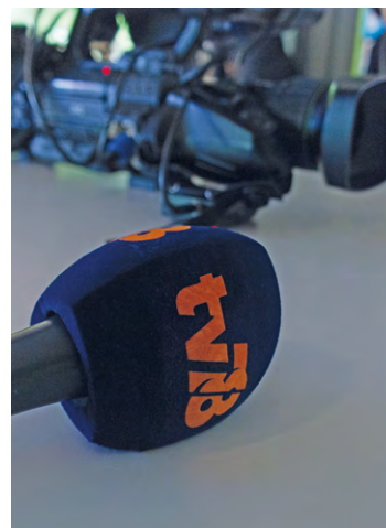
Ce jeu sera composé de quiz ludiques sur les Yvelines, le tout dans une « ambiance décontractée » et avec des cadeaux à gagner, indique la chaîne.

Ce jeu sera composé de quiz ludiques sur les Yvelines, le tout dans une « ambiance décontractée » et avec des cadeaux à gagner, comme le Petit futé Yvelines, un jeu de société, ou encore des casquettes, parapluies et gourdes TV78, affirment nos confrères. La première session de tournage se déroulera le 7 juin à la Commanderie, à Élancourt. Alors, pour faire partie de l'aventure, envoyez votre candidature par courriel