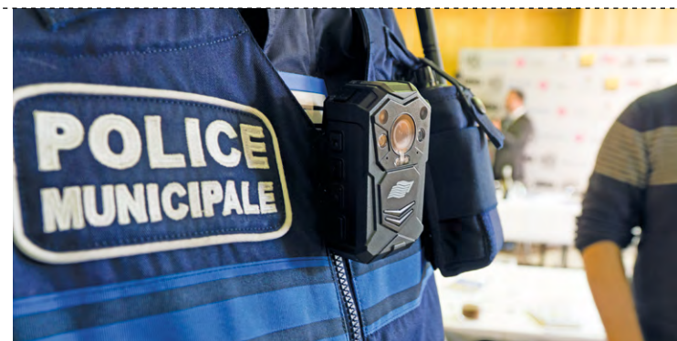
La police municipale de Guyancourt a effectué plusieurs démarches concernant l'occupation illégale de terrains dans la commune.

« Le 18 mars, nous avons donc sollicité le cabinet d'avocats de la ville de Guyancourt pour le dépôt d'une requête en référé auprès du tribunal. Le 24 mars, l'avocate de la Ville informe que la 1 ère date disponible auprès du greffe du tribunal judiciaire de Versailles est le 4 septembre. Il s'agit là d'une audience de fond. Les dates pour obtenir un passage du dossier en référé sont, elles, encore plus lointaines », regrette l'él.