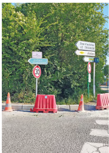
Des travaux de voirie ont été menés dans la rue de la Pépinière, à Villepreux, pour améliorer la sécurité de cet axe routier.

À Villepreux, plusieurs travaux de différentes natures ont été menés durant les vacances scolaires du mois d'avril.