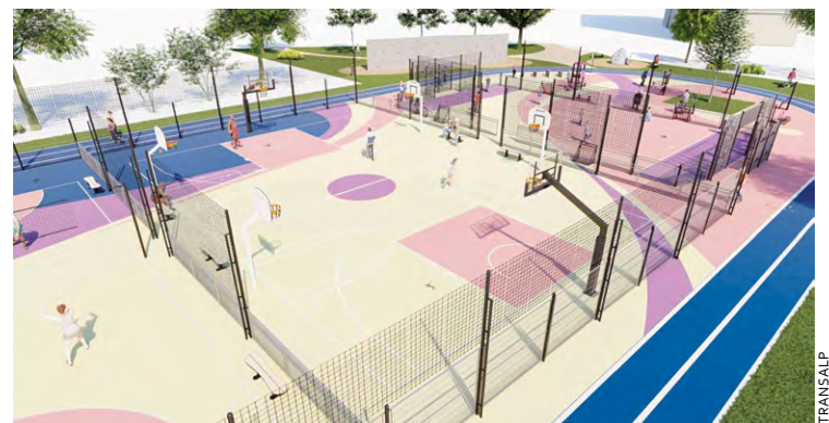
Le futur plateau d'évolution multisports des Clayes-sous-Bois doit voir le jour à côté du gymnase Dorine Bourneton d'ici fin août prochain.

Toutes ces Villes ont placé les aménagements sportifs de plein air au cœur de leur politique, mais d'autres à SQY ne sont pas non plus en reste. À Montigny-le-Bretonneux, un city stade incluant un terrain multisports et une zone d'exercices sportifs avec agrès a été livrée l'année dernière au stade