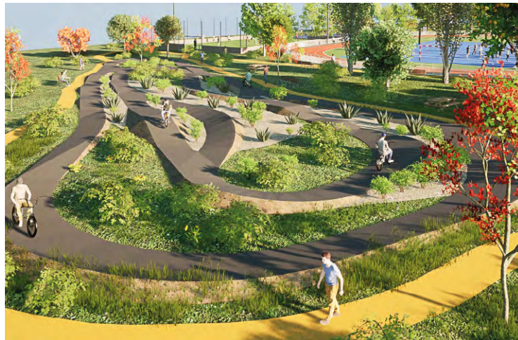
À Coignières, un pumptrack va être aménagé au sein de cette aire. Un équipement « réclamé par nos jeunes depuis de nombreuses années », selon le maire.

« La vocation de cet espace est de devenir un espace qui permet une pratique libre du sport. Mais un sport de loisirs plutôt