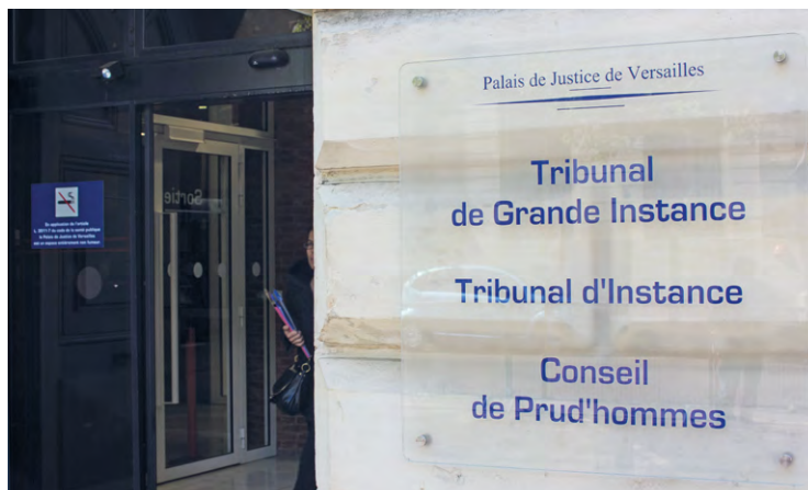
Le tribunal judiciaire de Versailles a condamné à deux ans de prison ferme un homme qui a attaqué le compagnon de sa voisine avec une machette.

Alors qu'il préparait tranquillement son gigot, un Plaisirois est sorti de chez lui et, suite à une altercation, a attaqué le petit ami de sa voisine en lui assénant un coup de machette sur le crâne.