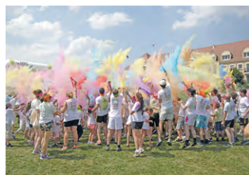
ILLUSTRATION LA GAZETTE DE SQY

Ces courses à pied agrémentées de jets de poudre colorée vont se dérouler à Guyancourt, Coignières et Montigny le 17 mai, et La Verrière le 25 mai.