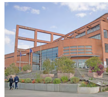
Les habitants peuvent s'exprimer par courriel à concertationanru@mairie-trappes.fr, ou dans des registres de concertation disponibles en mairie et à l'Espace 1901.

« Ce quartier prioritaire de la ville totalise plus de 5 250 logements sociaux et s'inscrit dans le cadre du Nouveau programme national de renouvellement urbain (NPNRU) », précise la Ville sur son site internet. Ce vaste projet permettra, entre autres, « d'améliorer les articulations avec le reste de la ville, notamment avec le secteur Jaurès-Gare, via le projet de l'Aérostair, le Village et l'aménagement du plateau urbain ; de maintenir et redynamiser l'activité commerciale ou encore de développer une offre de logements diversifiée », liste la commune.