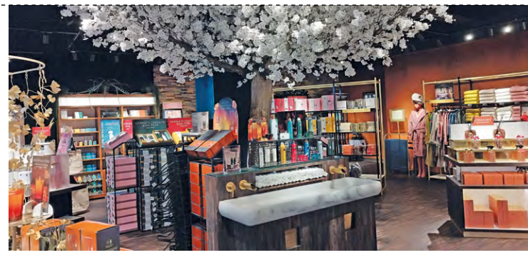
L'îlot d'eau permet aux client(e)s d'essayer la grande majorité des produits proposés à la vente.

L'équipe de la boutique est composée de 4 vendeuses à temps complet ainsi que d'une responsable et