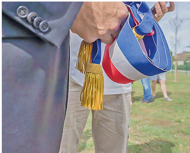
Les maires de SQY expriment leur colère contre l'État vis-à-vis des efforts financiers, toujours plus grands, qui leurs sont demandés.

Et d'ajouter : « Face à cet échec de l'État, les collectivités locales, pourtant exemplaires dans leur gestion [...] font d'importants efforts, depuis des années,