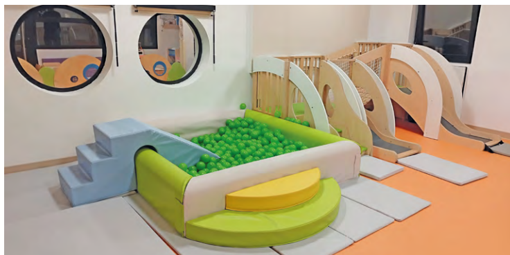
Les enfants ont par exemple à leur disposition cette salle de motricité qui est vaste, largement vitrée et dispose de jeux en bois et d'un mur qui améliore l'isolation phonique.

« Ici, les enfants peuvent, faire des jeux de peinture, de manipulation, de transvasement, c'est ce qu'ils aiment beaucoup