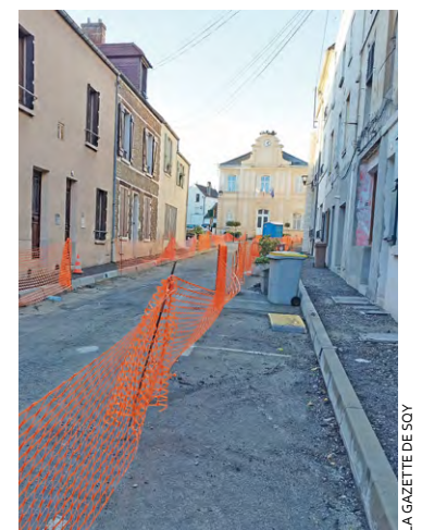
La rue Pierre Curie, située au Village, est fermée à la circulation pour cause de travaux. Une déviation a été mise en place.

Dans son Facebook live du 7 novembre, le maire MoDem de Villepreux, Jean-Baptiste Hamonic, a donné quelques précisions sur lesdits travaux. « Nous sommes bientôt