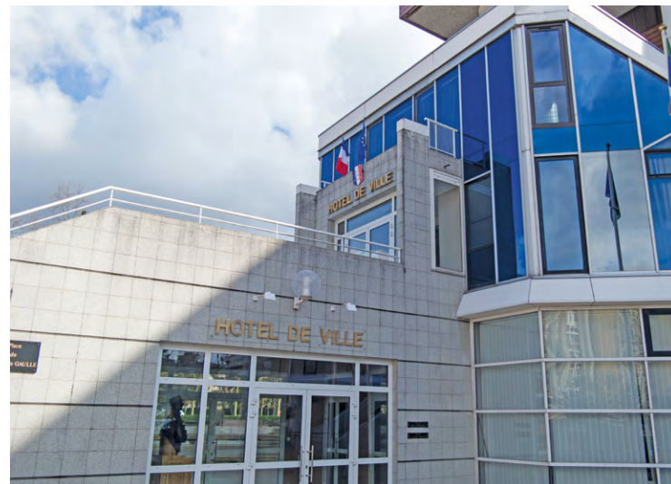
D'après certains habitants du quartier des Sept-Mares où se situe la mairie, des rats proliféreraient dans le parking souterrain de l'hôtel de ville.

Une Élancourtoise qui faisait ses courses à Maurepas a eu la mauvaise surprise de voir que des rats avaient rongé des éléments de sa voiture. Des nuisibles qui seraient également présents dans le parking souterrain de la mairie d'Élancourt, où elle se gare.