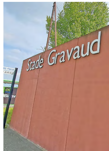
Le stade Gravaud bénéficie désormais d'un nouveau terrain synthétique, d'un city stade et d'un espace de street workout.

L'inauguration s'est déroulée en présence notamment de plusieurs élus locaux mais aussi de l'ex-footballeur professionnel Jacques Faty, international sénégalais et passé notamment par Rennes et l'OM. Elle a aussi été marquée par la pose de la 1 re pierre du futur bâtiment avec tribunes, étape suivante