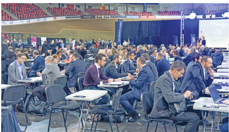
Des entrepreneurs de multiples secteurs se donneront rendez-vous et échangeront à l'occasion de cette convention d'affaires, comme ici lors de la dernière édition au Vélodrome, en 2019.

Ce rendez-vous d'affaire entre entreprises, principalement du territoire, se tient le 28 novembre au Vélodrome national, là-même où avait eu lieu sa dernière édition en présentiel, en 2019.