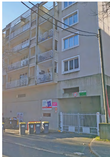
La résidence Stephenson, située dans la rue éponyme, dans l'Hypercentre de Montigny, va subir une réhabilitation de grande envergure.

« Un chantier ambitieux, porté par le bailleur Immobilière 3F, que nous avons défendu de longue date avec l'Amicale des locataires, pour que ce patrimoine bénéficie, comme le reste