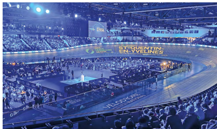
72 coureurs parmi les meilleurs au monde, dont 4 Français, s'étaient donné rendez-vous au Vélodrome le 23 novembre.

Organisée le 23 novembre au Vélodrome national, environ trois mois après que ce dernier ait accueilli les JO, la 1 re manche de l'UCI track Champions league 2024 a réuni pas loin de 4 000 spectateurs.