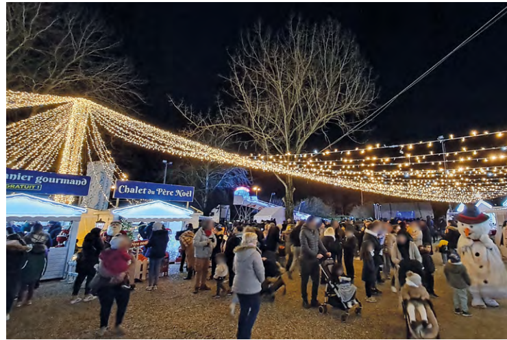
Les marchés de Noël (ici celui d'Élancourt l'année dernière) mettront des étoiles dans les yeux des visiteurs, des plus jeunes aux plus âgés.

Comme tous les ans, à partir de la toute fin novembre et tout au long du mois de décembre, les chalets des marchés de Noël et autres animations prennent place dans les villes de SQY.