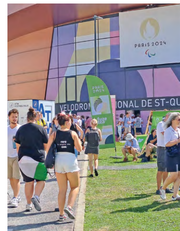
Épreuves, organisation, impact sur le quotidien, transports, sécurité, itinéraires cyclables, bénévoles, ou encore information durant les Jeux, différents points sont abordés dans ce questionnaire.

« Quels impacts ont eu les Jeux olympiques et paralympiques à SQY ? Dites-nous tout. Nous vous invitons à remplir ce court formulaire pour partager votre avis sur les effets des Jeux « à domicile ». Votre voix compte ! Que vous soyez