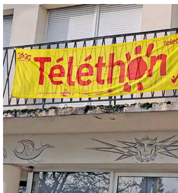
Chaque année, de nombreuses Villes et associations de SQY mettent en place des manifestations en faveur du Téléthon.

À Magny-les-Hameaux, les bénévoles de l'association Zic en herbe vous attendent le 29 novembre, dès 19 h au gymnase Mauduit, pour une succession de spectacles et d'activités divers proposés pour tous les âges. Pétanque, tennis, tir à l'arc, danses, massages par des professionnels... le programme s'annonce copieux. Le 30 novembre, un concours de précision ouvert à tous aura lieu, dès 14 h, au golf de Magny, situé sur la plaine de Chevincourt. Animé par l'association Vivre le Golf à Magny, la participation coûte 5 euros, qui seront intégralement reversés au Téléthon. Le matériel sera prêté aux participants.