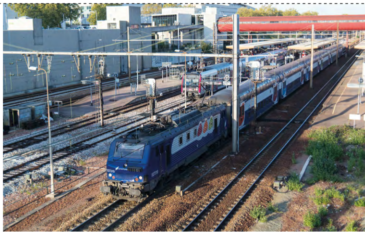
ILLUSTRATION LA GAZETTE DE SOY

Ce service permet d'indiquer aux voyageurs en temps réel la répartition de l'affluence du prochain train arrivant en gare selon trois niveaux : faible, moyenne et forte ; les voyageurs peuvent ainsi se positionner sur le quai en vue de monter dans une voiture moins chargée pour un trajet plus confortable ; une meil-