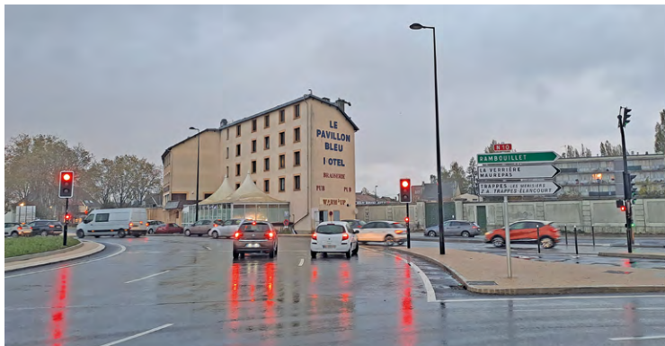
ILLUSTRATION LA GAZETTE DE SOY

Cette nouvelle étape du chantier, qui devrait normalement démarrer à compter du 15 juillet prochain, prévoit la création d'une voirie provisoire préalable à l'enfouissement de la RN 10.