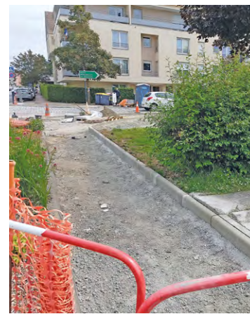
Les trottoirs vont être entièrement refaits dans l'avenue du Forez et la rue des Baux. Un arrêt de bus accessible aux PMR va également voir le jour.

Cette première phase de travaux, qui a débuté à la fin du mois de juin, va se poursuivre jusqu'au 15 juillet. Dans un second temps, à partir du 29 juillet, les travaux concerneront les routes, « et notamment le carrefour pavé entre les deux rues, qui va être totalement repris, en même temps que les autres couches de roulement », précise la Ville. En conséquence, l'avenue du Forez et la rue des Baux seront fermées à la circulation le lundi 29 juillet, de 8 h à 18 h. Le lendemain