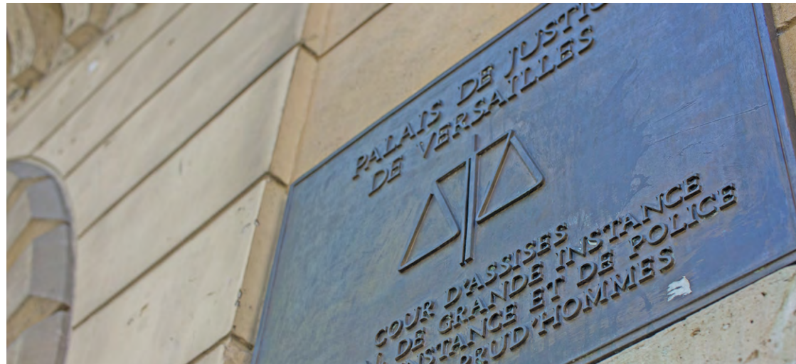
ILLUSTRATION/LA GAZETTE DE SOY

Les réseaux sociaux sont parfois à l'origine de dérives néfastes et incontrôlées. Un Verriérois a publié des messages sur X (anciennement Twitter) où il a fait l'apologie publique d'actes de terrorisme.