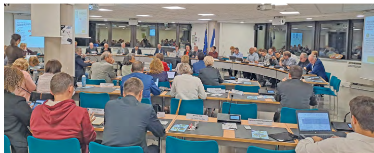
Le projet de crématorium a fait l'objet d'une délibération en conseil communautaire de SQY. Il doit répondre à l'augmentation du nombre de décès et au développement de ce type de pratique funéraire.