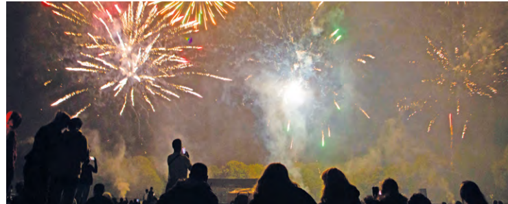
Le ciel va encore briller de mille feux dans plusieurs communes de SQY à l'occasion de la Fête nationale.

Comme chaque année, plusieurs Villes organisent, seules ou en intercommunalité, des festivités et notamment des feux d'artifice pour célébrer la Fête nationale.