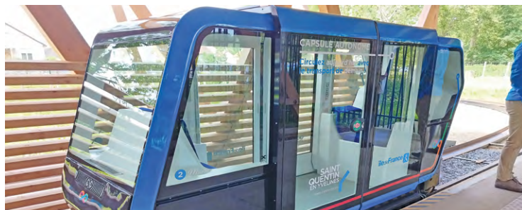
Les dix capsules déployées peuvent accueillir deux adultes ou un adulte et deux enfants. Il suffit d'appuyer sur un bouton pour voyager de manière écologique et sécurisée, d'un bout à l'autre de l'île de loisirs.

Quant au grand public, il pourra découvrir gratuitement ce nouveau mode de transport, qui a obtenu le record mondial en termes de consommation énergétique pour un véhicule autonome sur rails, le 27 juillet avec un premier départ prévu à 11 h. Ces dix capsules déployées, qui peuvent transporter deux adultes ou un adulte et deux enfants, font une boucle de 2 km à la vitesse maximale de 50 km/h. Elles permettent notamment de rejoindre