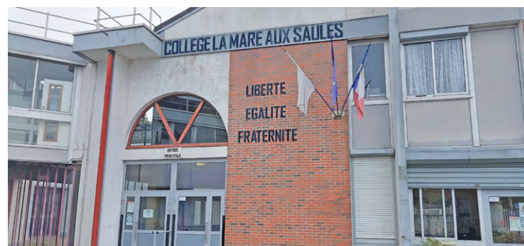
Le collège la Mare aux Saules a été construit en 1981. Il commence à sérieusement accuser le poids des années, c'est pourquoi il va être entièrement reconstruit dans les prochaines années.

Le collège aura un double parvis, un extérieur accessible directement depuis les arrêts de bus et le dépose minute et un à l'intérieur, où se trouvera un grand local à vélo. Un ascenseur pour PMR desservira les étages. Et 5 petites maisons de fonction pour le personnel, avec des parkings extérieurs et des jardins privatifs, seront érigés.