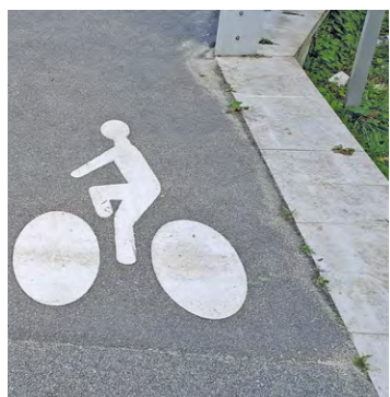
Face à des études techniques montrant que « la réalisation de pistes cyclables réglementaires [...] est impossible », il a été opté pour du « chaussidou » et un double sens cyclable, évoque la Ville.

Dans le cadre du Schéma directeur cyclable de SQY visant à doubler la part mondiale du vélo de 3% à 6% d'ici 2030, plusieurs aménagements cyclables sont prévus à La Verrière, ville jusqu'ici assez en retard en la matière. Présentés en réunion publique il y a un an (lire notre édition du 4 juillet 2023), ils entrent dans la phase concrète avec