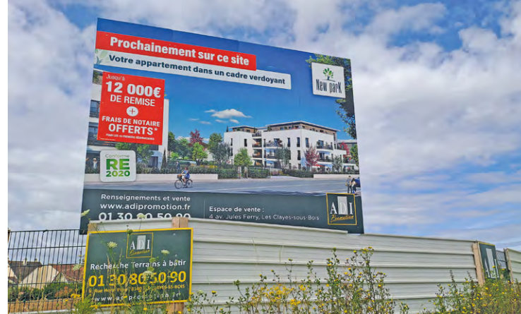
Les travaux sur ce secteur ont commencé fin mai. Ils doivent aboutir à la construction de 150 logements, dont 45 sociaux, d'ici début 2026.

La gestion de la partie sociale des logements est confiée à Logirep (le même bailleur que sur la résidence de l'Avre). Le promoteur ADI Promotion, qui porte cette opération immobilière, a finalisé il y a quatre ou cinq mois l'acquisition du terrain, composé de plusieurs parcelles qui appartenaient à des propriétaires privés.