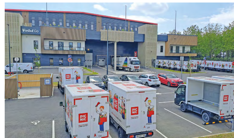
Quatre entreprises sont déjà installées au sein du Segro Park Élancourt, dont Vinted Go (plateforme de vente de vêtements de seconde main en ligne), et Picnic (supermarché en ligne).