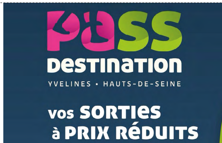
Le Pass Destination permet de profiter toute l'année de 15 % de réduction minimum dans plus de 100 sites touristiques, culturels, sportifs et de loisirs.

Et l'offre culturelle et naturelle, entre châteaux, musées, activités de pleine nature, activités sportives... est particulièrement diversifiée