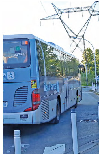
La navette scolaire gratuite pour les élémentaires du Bois de l'Étang, qui les conduit jusqu'à l'ERPD (École régionale du premier degré) sera reconduite à la rentrée, pour la 2 e année de suite.

Les inscriptions sont gratuites jusqu'au 31 juillet et gérées uniquement par le service Circuit spécial scolaire (CSS) de Île-de-France Mobilités (IDFM). Le titre de transport annuel « carte Scol'R » sera réceptionné au cours de l'été 2024 par voie postale. Cette carte est obligatoire pour accéder au bus. Le transporteur fera une liste des élèves sans cartes qui se verront notifier par le service CSS via une lettre d'avertissement avant une possible exclusion temporaire comme prévu au règlement intérieur.