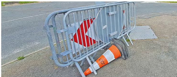
L'objectif des travaux rue de Bretagne et avenue de Normandie est de « procéder à la réfection des chaussées et de reprendre les trottoirs », explique la commune.

La mairie et SQY ont entrepris des reprises de chaussées et de trottoirs dans ces deux quartiers.