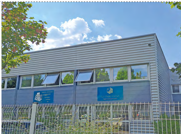
L'entreprise Go wood event est située dans la zone d'activités de l'Observatoire, à Montigny-le-Bretonneux.

Et de préciser que, « à travers leurs Talents, les 31 structures du réseau BGE souhaitent valoriser ces dirigeants de petites entreprises qui prouvent au quotidien leur résilience, leur inventivité et leur capacité à rebondir ». Ainsi, ce sont 38 parcours d'entrepreneurs qui ont été sélectionnés dans toute la France. Ils seront mis en lumière chaque mardi sur le site BGE et dans une web-série de 14 épisodes (un par région), diffusée à l'automne. L'objectif étant d'observer la réalité entrepreneuriale à travers le parcours de ceux qui créent.