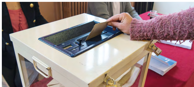
De nombreuses triangulaires se profilent dans les circonscriptions comprenant des communes de SQY, où les candidats du camp présidentiel, contrairement à la tendance nationale, résistent bien.