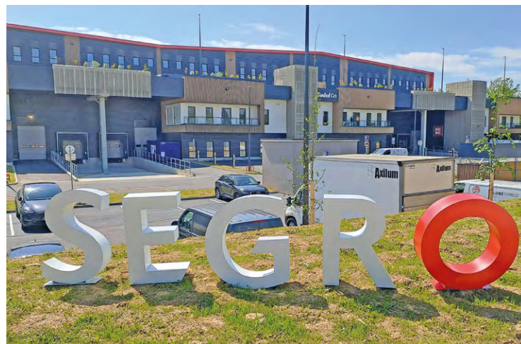
Ce bâtiment de 13 000 m 2 se compose de dix cellules réparties sur deux étages d'activités et est donc le premier parc d'activités à étages développé par Segro en France.

Un nouvel espace pour continuer à dynamiser un haut lieu d'innovation. Début juin, le jeudi 6 exactement, le groupe Segro a inauguré son premier parc d'activités à étages en France, le Segro Park Élancourt. Depuis 1920, Segro crée des solutions immobilières pour la logistique, la distribution urbaine et l'activité, permettant de répondre aux besoins d'un large éventail de clients sur l'intégralité de la chaîne logistique, quel que soit le secteur d'activité et la taille de l'entreprise.