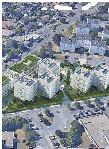
Cette réhabilitation d'ampleur des 134 logements existants, des espaces extérieurs et du parking, doit s'achever en septembre 2026.

Le quartier de la Pointe à l'Ange, à Villepreux, va faire l'objet d'un grand projet de rénovation. Ce projet, qui sera réalisé en même temps que la construction de nouveaux logements, doit permettre de dessiner un nouveau visage à cette résidence (lire nos éditions du 7 décembre 2021 et du 13 juin 2023). Une réunion publique d'information s'est tenue le 19 juin, à l'espace Petrucciani, en présence des locataires, du bailleur Logirep ainsi que des élus. Elle a permis de mettre en avant l'ensemble des points concernant la réhabilitation de la résidence et d'exposer le programme des nouvelles constructions, de présenter les membres de la nouvelle Amicale des locataires, et enfin de réserver un temps d'échange privilégié avec les locataires.