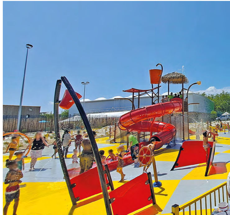
À Trappes, l'édition 2024 de Trappes plage, se déroule du 6 juillet au 30 août dans le cadre de L'Été à Trappes, avec des équipements rénovés depuis l'année dernière à la piscine Monquaut.

Comme chaque année, de nombreuses communes de SQY proposent un riche programme d'activités, notamment pour les enfants et jeunes n'ayant pas la chance de partir en vacances estivales.