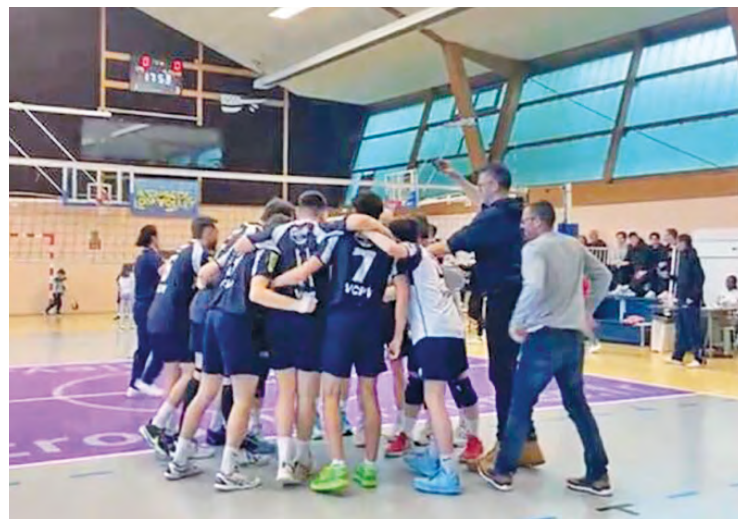
Les joueurs du VCPV n'ont pas tremblé à Rennes, pour s'imposer 3 sets à 1 (25-23 ; 25-19 ; 17-25 ; 25-18) et dérocher ainsi leur 16 e victoire en 18 matchs cette saison, et surtout leur montée en N2.

Fort de son succès 3 sets à 1 chez le CPB Rennes 35, le 5 mai lors de la dernière journée de la phase régulière du championnat, le VCPV accède à la N2 un an seulement après avoir été promu en N3.