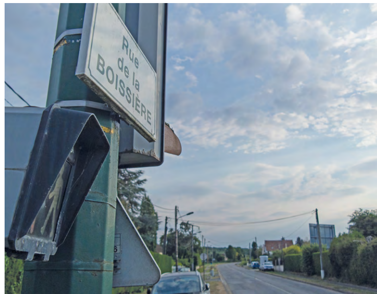
Des riverains de ce quartier résidentiel, à Plaisir, se sont plaints de l'augmentation des cambriolages et des actes de vandalismes à la maire lors d'un Facebook live.

La maire LR de Plaisir, Joséphine Kollmannsberger, a indiqué lors de son Facebook live du 29 avril, que la commune connaissait une recrudescence des cambriolages et actes de vandalisme.