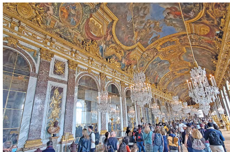
La galerie des Glaces du château de Versailles, très arpentée par les touristes, a été prise pour cible par deux activistes de Riposte alimentaire.

L'action, qui a interloqué de nombreux touristes présents au