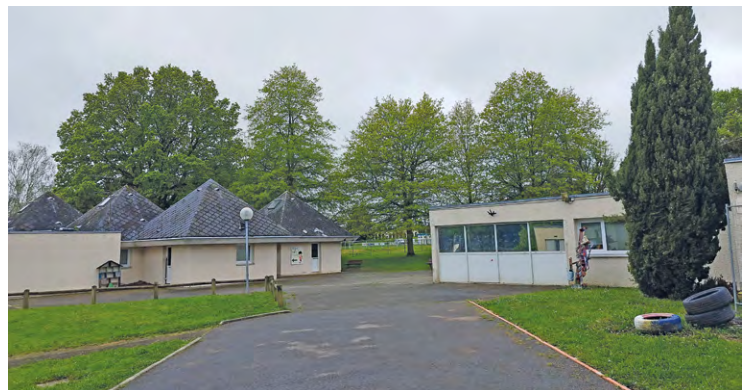
L'actuel Centre de loisirs primaire, qui se trouve au sein du quartier du Village, à Maurepas va laisser place à un tout nouveau bâtiment en 2025. Les travaux vont débuter dans quelques mois.

Le Centre de loisirs primaire (CLP), installé dans le quartier du Village, à Maurepas, qui accueille les enfants âgés de 6 à 12 ans, sera bientôt remplacé par un nouvel équipement flambant neuf. Ce nouvel édifice entièrement repensé ouvrira fin 2025, sur la même parcelle, juste à côté de l'actuel.