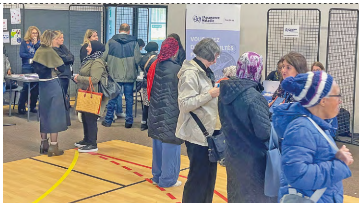
Le Forum Ressources, organisé au gymnase de la Fraternité, a rencontré son public.

Mais de nombreux autres organismes, en plus du café des habitants, qui était un des points forts de l'événement, étaient présents pour prodiguer de précieux conseils. On peut citer, entre autres, la CPAM, la CAF, le Pôle autonomie, Pimms Médiation (Points d'information médiation multi services), l'Udaf