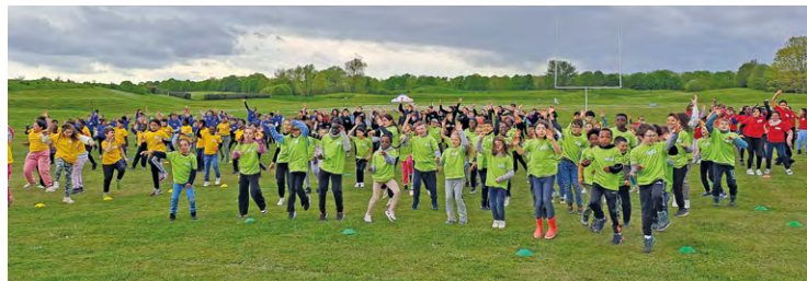
Au total, 250 enfants ont pratiqué le golf, mais aussi plusieurs disciplines pédagogiques sur le thème de la petite balle blanche, et ont conclu leur journée par un flash mob.