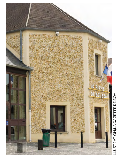
La ferme de Bel Ébat accueille le 15 mai, un spectacle s'appuyant sur l'œuvre de Kae Tempest, figure du spoken word.

La ferme de Bel Ébat, à Guyancourt, accueille le 15 mai, de 20 h 30 à 22 h, un spectacle s'appuyant sur l'œuvre de Kae Tempest, figure du spoken word (manière d'oraliser un texte en s'appuyant sur plusieurs formes d'art mais en se concentrant sur les mots eux-mêmes), artiste non binaire, se distinguant à la fois dans la musique, le théâtre, l'écriture de romans. Cette représentation, intitulée Tempest , met en scène la jeune troupe de Bel Ébat, qui « explore notre monde en mutation à travers l'œuvre d'une grande voix du spoken word », indique la description du spectacle. « Tempest parle de notre monde en mouvement, de la force qu'il faut pour l'affronter, de l'espoir qu'il nous faut entretenir pour faire face à la grande métamorphose que nous traversons tous. Tempest tient tout entier dans une oscillation – entre masculin et féminin, entre l'ancien et le moderne, le raisonnement et l'intuition, le biographique et l'universel... Une sorte de mouve-