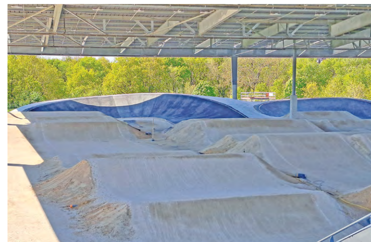
La piste du Stadium de BMX situé en face du Vélodrome, et qui accueillera les épreuves des BMX racing durant les prochains JO, a été revisitée pour un montant de 500 000 euros.

Enfin, le Golf national de Saint-Quentin-en-Yvelines sera le seul au monde à avoir accueilli la Ryder cup et les Jeux olympiques. Il est d'ores et déjà reconnu comme l'un des meilleurs parcours de championnat en Europe. Il compte trois parcours adaptés à tous les niveaux de jeu : l'Albatros, parcours mythique de la Ryder Cup 2018, l'Aigle superbe parcours accessible dès 36 d'index et l'Oiselet, parcours 7 trous idéal pour les débutants ou les joueurs pressés. Il est chaque année le site