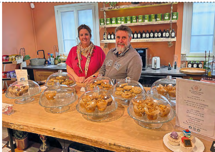
« Ce sont [...] des pains chauds et croustillants avec l'intérieur qui reste froid. Les crudités restent croquantes et ne cuisent pas avec le sandwich », explique la responsable au sujet des nouveaux produits proposés.

Et désormais, ils aimeraient relancer les brunchs le dimanche après la période des fêtes, en janvier. « Nous avons trois types de formules : une salée, une sucrée et une sucrée-salée avec nos produits et évidemment toujours sur réservation pour pouvoir préparer au mieux », précise le couple. Ils souhaitent aussi proposer des afterworks, un jeudi soir par mois, jusqu'à 21 h (le salon, de thé ferme à 18 h d'habitude). « L'idée est de prendre un thé, un café, un