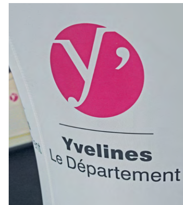
Le label Artisan a été lancé en 2023 par la Chambre des métiers et de l'artisanat, en partenariat avec le conseil départemental des Yvelines et la Banque Populaire Val de France.

Les critères de sélection sont : la contribution à l'artisanat de bouche ou à l'artisanat d'art et de création, l'esprit innovant et créatif de l'artisan, l'originalité de l'entreprise et de son offre, la valeur ajoutée apportée par l'artisanat dans la région, la représentativité du savoir-faire local, la qualité de l'accueil réservé aux clients et les activités proposées à la clientèle, telles que des ateliers, des cours et des démonstrations.