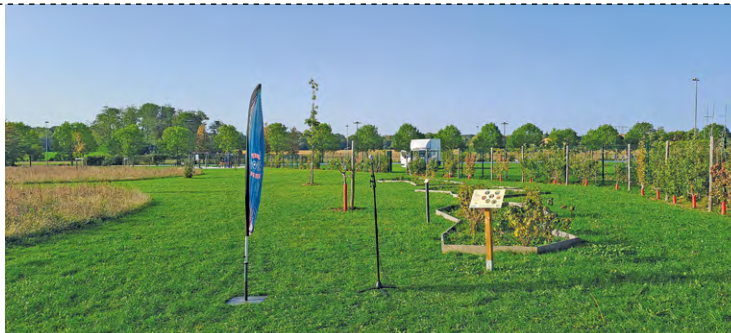
Les parcours comestibles ont été inaugurés le 7 octobre. Si l'un fait 3 km et s'effectue en 45 minutes, les deux autres sont respectivement longs de 10 et 14 km et nécessitent 2 et 3 h de marche.

L'élue poursuit : « En discutant de ce projet avec les associations et les services, on a aussi convenu qu'il y avait d'autres potentiels sur la commune que ce qu'on avait planté. En l'occurrence, les plantes sauvages, les baies qu'on trouve en forêt, les châtaignes ou les plantes sauvages qui poussent au bord des chemins. On est aussi une commune où il y a du patrimoine fruitier très important. »