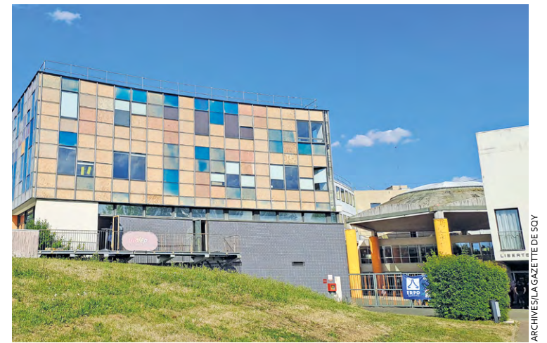
Depuis la rentrée de septembre, l'ERPD accueille les 174 élèves de l'école élémentaire du Bois de l'Étang, détruite pour un incendie dans la nuit du 28 au 29 juin dernier.

Les premiers échanges avec l'Éducation nationale font semble-t-il ressortir des retours très positifs et la volonté de privilégier des espaces modulables, selon le souhait de l'académie. Pour une enveloppe autour de 25 millions d'euros, le groupe scolaire devrait être reconstruit sur l'emplacement de l'école élémentaire qui a été brûlée. « Nous ne toucherions pas à la maternelle pendant la durée des travaux. Cela pourrait se faire en site occupé. D'autant que le projet doit normalement prendre trois ans, remarque le maire. Nous espérons avoir des financements de l'Anru (Agence nationale du renouvellement urbain) aussi, car cette école était concernée par l'Anru. »