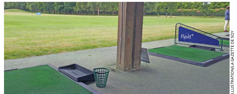
Le Golf national, futur site sélectionné pour les Jeux olympiques de Paris 2024, a été victime d'un nouvel acte de vandalisme.

Le Golf national de Saint-Quentin-en-Yvelines a, de nouveau, été détérioré dans la nuit du vendredi 3 au samedi 4 novembre.