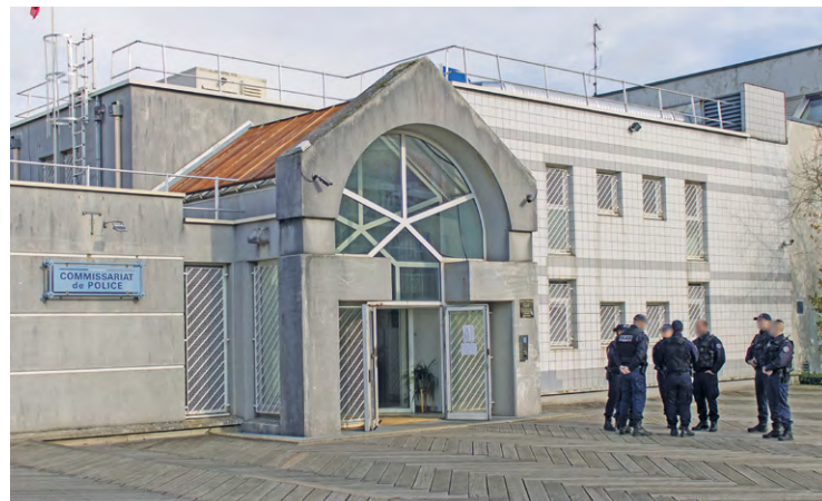
Le commissariat de Trappes a été visé par des tirs de mortiers d'artifice durant la soirée d'Halloween.

La nuit du 31 octobre a été entachée par plusieurs événements mineurs dans l'Agglomération, qui se sont produits à Trappes, Plaisir et Maurepas.