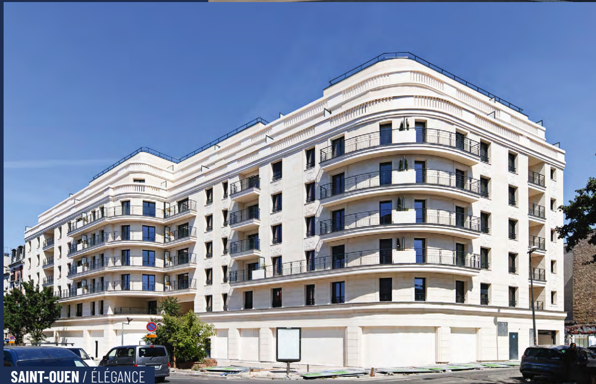
SAINT-OUEN / ÉLÉGANCE

24 Avenue du Gué Langlois 77600 Bussy-Saint-Martin