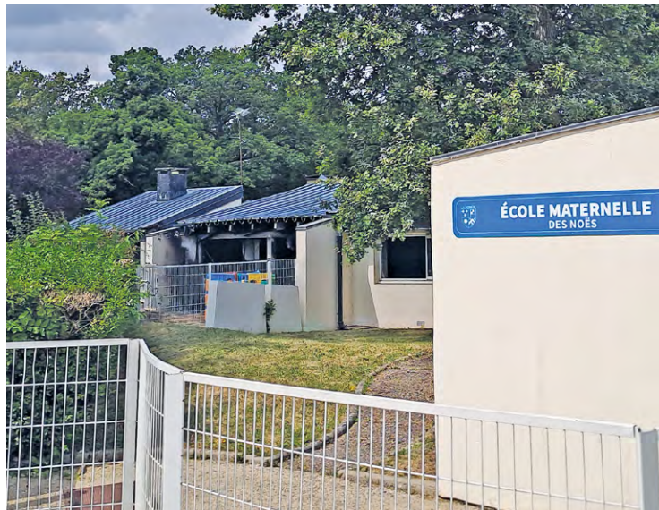
Le nouveau groupe scolaire regroupera l'école des Noés et l'école du Bois de l'Étang en tenant compte de la prospective scolaire du quartier.

Et de poursuivre : « Et puis il y a eu une formidable mobilisation des partenaires. La Région et l'Agglomération nous ont beaucoup aidés pour mettre en place les lignes de bus pour emmener les enfants [...] à l'ERPD [...]. Ce sont tout de même trois bus, matin, midi et soir avec des allers-retours pour le déjeuner. Cela coûte tout de même 300 000 euros et c'est financé par Île-de-France Mobilités et par moitié par l'agglomération de Saint-Quentin-en-Yvelines. C'est une aide extrêmement précieuse pour éviter tout risque de déperdition scolaire et faciliter la vie des familles malgré l'épreuve. »