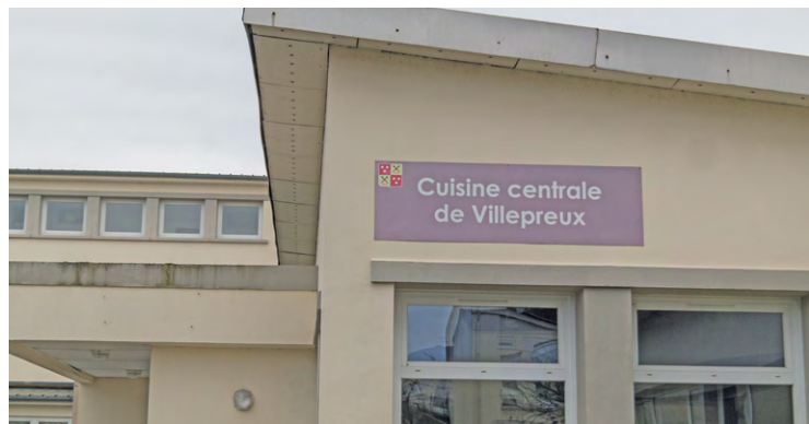
L'électrocomposteur avait pris place de fin 2021 à fin 2022 à la cuisine centrale.

Durant un an, de fin 2021 à fin 2022, la commune de Villepreux, en lien avec Saint-Quentin-en-Yvelines, a testé un nouveau concept d'électrocomposteur pour la cuisine centrale. Le résultat étant jugé non concluant, cette expérimentation a été arrêtée.