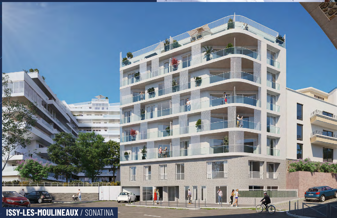
ISSY-LES-MOULINEAUX / SONATINA