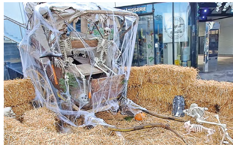
De nombreuses animations et décorations d'Halloween s'invitent à SQY en cette fin du mois d'octobre.

Outre le concours de décorations (lire notre édition de la semaine der-