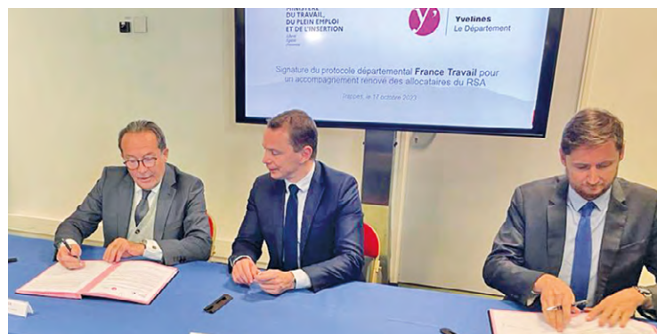
Le choix des Yvelines n'est pas anodin, « c'est l'une des plus importantes expérimentations en France avec presque 5 000 bénéficiaires du RSA », selon Olivier Dussopt (au centre sur la photo).

Le mardi 17 octobre, c'est à Trappes, dans les locaux de la Caf des Yvelines, qu'Olivier Dussopt, ministre du Travail, du Plein emploi et de l'Insertion, est venu signer la convention d'expérimentation