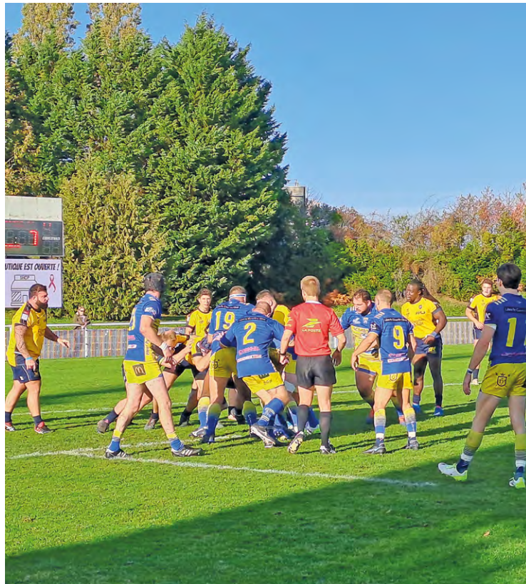
Les Jaune et Bleu de Plaisir n'ont fait qu'une bouchée d'Amiens (victoire 54-7), le 22 novembre à domicile lors de la 5 e journée de Fédérale 2.

Ambitieux mais prudents, les Plaisirois ont pulvérisé Amiens (54-3) le 22 octobre, enchaînant leur 5 e victoire bonifiée en autant de matchs.