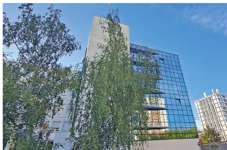
Ramsay Santé souhaite ainsi « proposer un accès direct à une équipe médicale spécialisée en cas d'anomalie suspectée pour une consultation et/ou des examens d'imagerie afin d'établir un diagnostic précis ».

L'Hôpital privé de l'Ouest parisien propose désormais un « Accueil sein » dans son établissement.