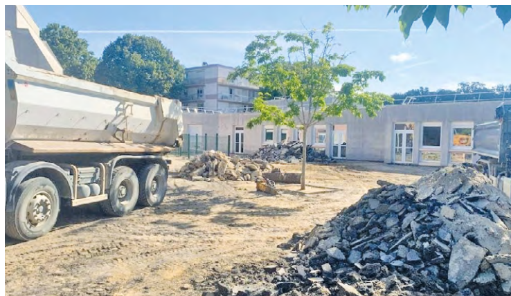
« On a fait un gros travail pour enlever du goudron, [...]. Tout le travail de modelage de l'ensemble du terrain est fini, on a des pelouses qui ont été plantées », glisse le maire.

Après l'école Corot-Samain en avril dernier, la ville de Magny-les-Hameaux s'attaque désormais à la végétalisation de la cour d'un deuxième établissement de la commune, dans le cadre du projet « Ma cour passe au vert ». Les travaux ont commencé depuis début juillet dernier à l'école André Gide, dans le quartier du Buisson.