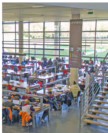
La bibliothèque de l'UVSQ, à Guyancourt, accueille l'exposition Cryptorigami jusqu'au 11 décembre.

L'exposition Cryptorigami – La vie pliée des champignons se tient à la bibliothèque universitaire de SQY jusqu'au 11 décembre.