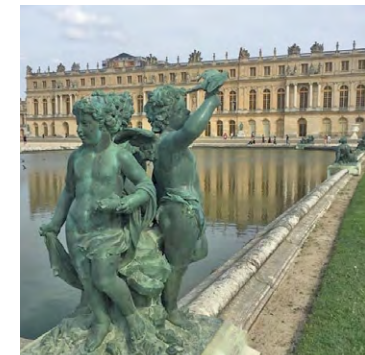
Chaque jour, le lieu est visité par des milliers de touristes, entre 10 000 et 15 000 personnes.

Le maire DVD de Versailles, François de Mazières, explique pourquoi cela est problématique. « Des visiteurs hésitent à venir maintenant », a-t-il déclaré le vendredi 20 octobre à Franceinfo. « Ça pose de très gros problèmes en termes de fonctionne-