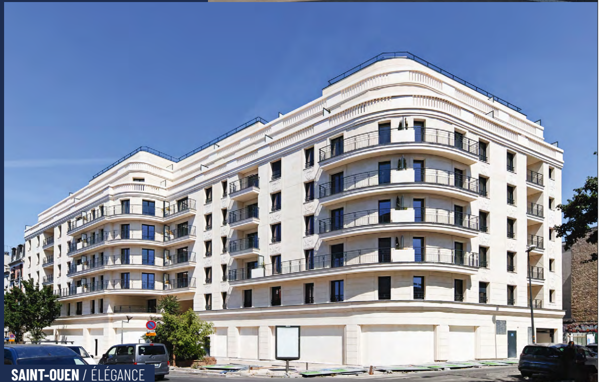
SAINT-OUEN / ÉLÉGANCE

24 Avenue du Gué Langlois 77600 Bussy-Saint-Martin