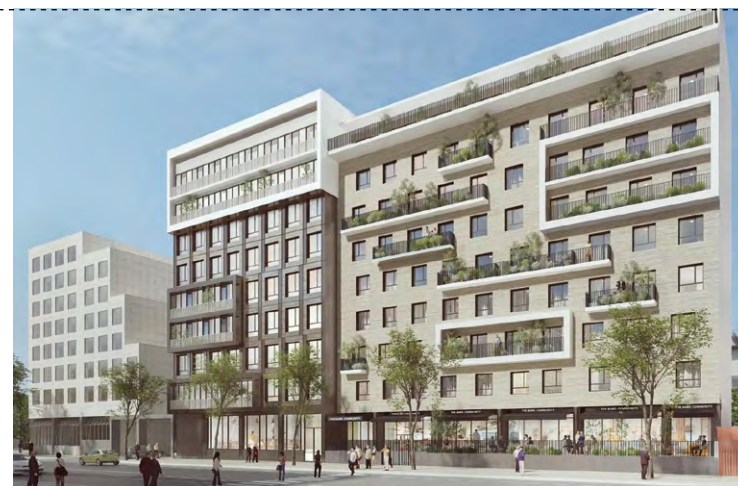
The Babel Community sera propriétaire du bâtiment principal et y développera son concept mêlant « de l'hébergement, du coworking, de la restauration, du sport », affirme son président.