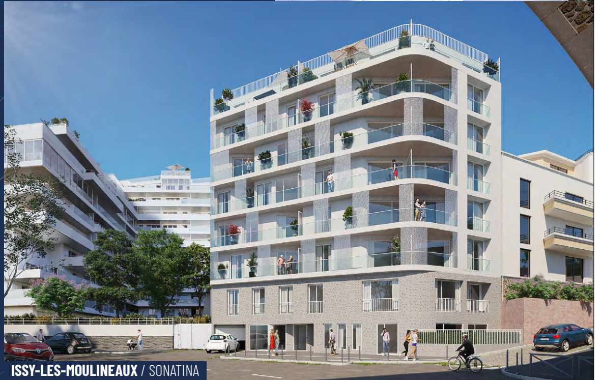
ISSY-LES-MOULINEAUX / SONATINA