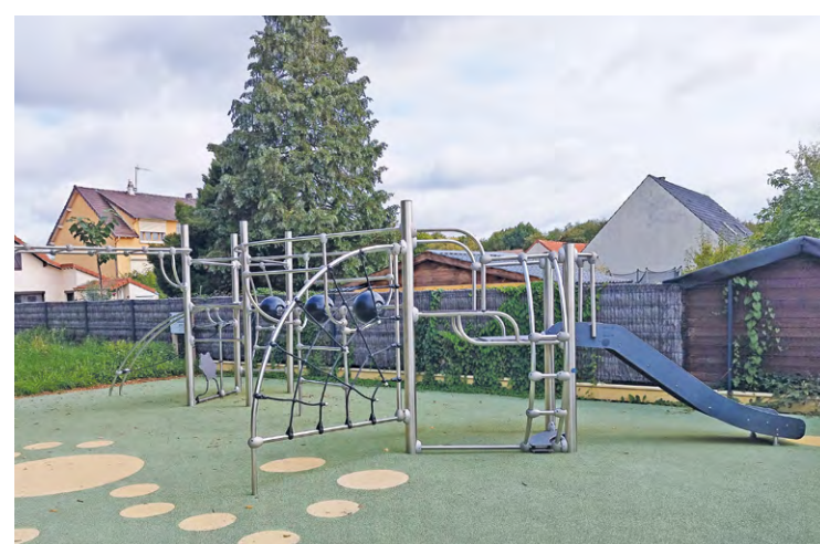
Des travaux sont menés au sein du square de la rue des Fleurs depuis le mois de juin. Un petit toboggan va être installé ainsi qu'une maisonnette récupérée au square Auguste Bernard.

La Ville a décidé d'investir pour rénover deux nouvelles aires de jeux à destination des enfants après les aménagements opérés sur les jeux installés à Orly Parc 1 et 2.