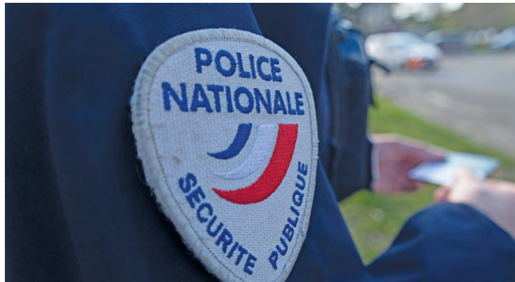
La police a arrêté un homme qui avait cambriolé un pavillon. Il était reparti au volant de la voiture de la victime.

Un homme, tout juste majeur, a dérobé une voiture dans un pavillon à Villepreux. Alerté à distance, le propriétaire a géolocalisé sa voiture à Plaisir. Les policiers se sont déplacés pour arrêter le voleur.