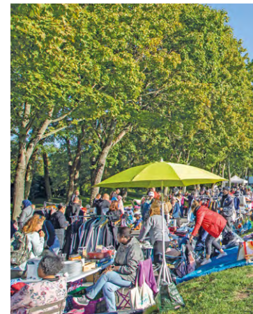
À Élan-court, la Fête d'automne sera de retour le 17 septembre, de 9 h à 18 h, entre les ronds-points du Pré Yvelines, Cassina de Pecchi et des Droits de l'Homme et du Citoyen.

À Élan-court, la Fête d'automne sera de retour le dimanche 17 septembre, de 9 h à 18 h, entre le rond-point du Pré Yvelines, le rond-point Cassina de Pecchi et le rond-point des Droits de l'Homme et du Citoyen. Les inscriptions sont en ligne via l'Espace Citoyen, ou sur l'application Élan-court.