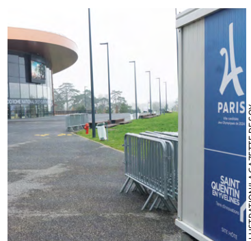
Les critères de sélection sont : avoir au minimum 18 ans au 1 er juillet 2024, s'engager à être disponible huit demi-journées, parler français et/ou anglais.

Les personnes sélectionnées seront ensuite formées à leur mission, mais aussi en langues et aux gestes de premiers secours. Elles disposeront également de supports en ligne et seront équipées de la tenue officielle du programme bénévoles. Ces derniers auront pour missions d'accueillir du