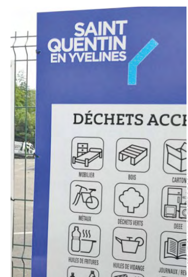
La déchetterie de Plaisir imite ainsi d'autres déchetteries de SQY, qui ont déjà adopté cette initiative.

Ainsi, il est désormais possible de déposer à la déchetterie de Plaisir des produits nocifs pour la santé et l'environnement tels que les déchets des produits de bricolage et de décoration, les déchets des produits du jardinage, les déchets