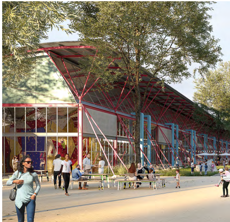
L'EPA Paris-Saclay propose d'ouvrir la fameuse halle Piano ainsi qu'une tour de visée. L'objectif pour l'EPA Paris-Saclay est de développer l'animation du futur quartier.

La halle Piano est un ancien bâtiment industriel de 8 800 m 2 sur deux niveaux. Elle est complétée par une tour d'environ 200 m 2 . Les deux bâtiments s'ouvrent sur un espace paysagé d'environ 4 hectares. Le bâtiment est composé de différents espaces : pièces de tailles différentes, grandes hauteurs sous plafond..., ce qui permet d'envisager des activités de tailles variées, ouvertes au public ou non. Les bâtiments ont vocation à être conservés à terme, permettant d'envisager des occupations de longue durée mais aussi des occupations plus courtes (minimum un an). Les locaux seront mis à disposition en contrepartie d'une redevance qui sera fixée en fonction du modèle économique et du type d'activité porté par les candidats.