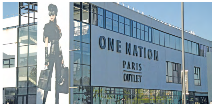
« Après une année 2022 record, [...] One Nation [...] affiche une croissance de sa fréquentation de + 10,95 % depuis le début de l'année versus 2022 », annonce le centre commercial.

Selon la direction du centre, cette forte croissance serait portée « par les fondamentaux du centre, le renforcement de l'offre de marques mais aussi par le plan « feel good shopping » lancé par le centre au sortir de la pandémie de Covid ». Ainsi, l'offre du centre a été renforcée par un élargissement et une montée en gamme avec les arrivées récentes de Estée Lauder (marques Tom Ford, Jo Malone, MAC, Bobby Brown, Origins, etc.), Outly (lunettes Dior, Prada, Gucci, Ray-Ban...), STDupont, Sonia Rykiel, etc.