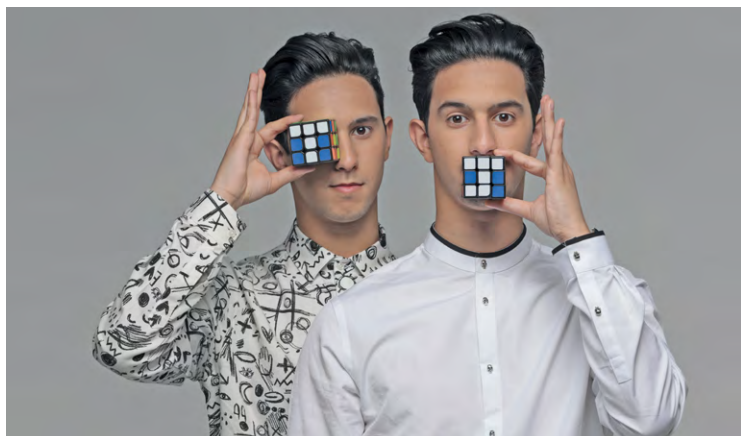
Programmés le 10 septembre, les French Twins seront les 1 ers à se produire à Trappes cette saison.

La halle culturelle trappiste est la 1 re des salles de spectacles saint-quentinoises à ouvrir sa saison 2023-2024, le 10 septembre.