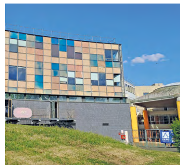
L'ERPD, située dans le quartier d'Orly parc, à La Verrière, accueillera les élèves verriérois de l'école élémentaire du Bois de l'Étang à compter de la rentrée.

En raison de l'incendie de l'école du Bois de l'Étang, la ville de La Verrière, la Région, Île-de-France Mobilité et SQY mettent en place un transport par bus pour les enfants scolarisés à l'École régionale du premier degré (ERPD). Un accompagnateur de la Ville sera présent dans chaque bus pour assurer les trajets des enfants. « Nous avons le plaisir d'informer les parents des élémentaires du Bois de l'Étang que la carte Imagin'R ne sera finalement pas nécessaire pour bénéficier du service de navettes scolaires du Bois de l'Étang vers l'ERPD, annonce la municipalité. Les parents ayant déjà souscrit au passe annuel seront intégralement remboursés par la Ville. Nous vous invitons à vous rapprocher du service scolaire pour le remboursement : service.scolaire@mairie-laverriere.fr / 01 30 13 76 24. Une carte nominative sera remise en classe lors de la semaine