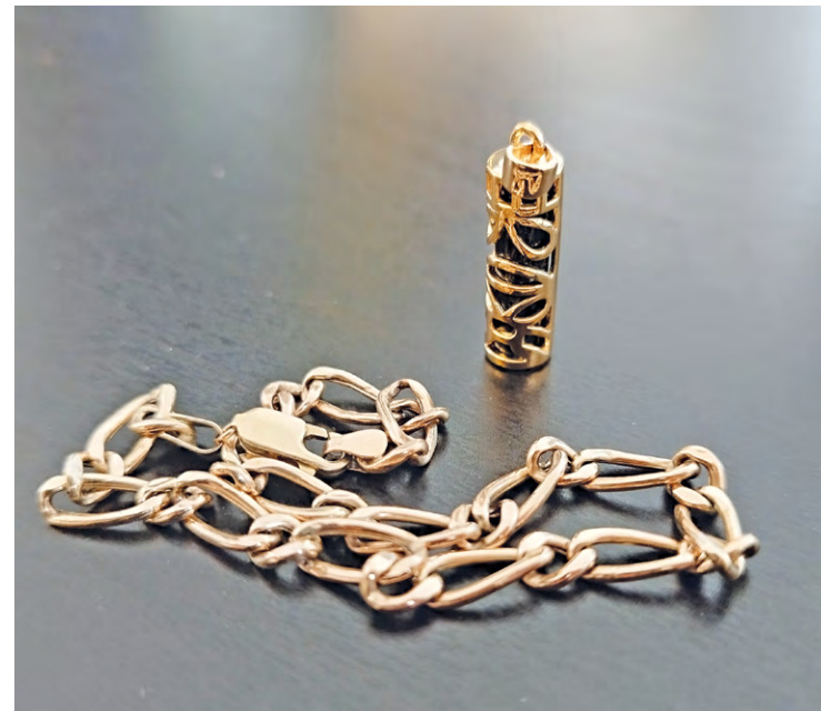
Une femme âgée de 28 ans a tenté de s'emparer de 7 100 euros de bijoux en or dans un commerce d'achat et de revente destiné aux particuliers installé à Coignières.

Quant à la carte bancaire, elle a servi à effectuer des achats fraudu-