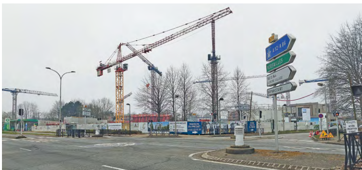
Le Département des Yvelines prévoit la fermeture de la liaison avenue de la Pyramide (nord) avec la Route départementale 36 (RD36) jusqu'au 30 octobre.

Avec les travaux du Département, l'accès à la RD36 par l'avenue de la Pyramide est fermé jusqu'à fin octobre.