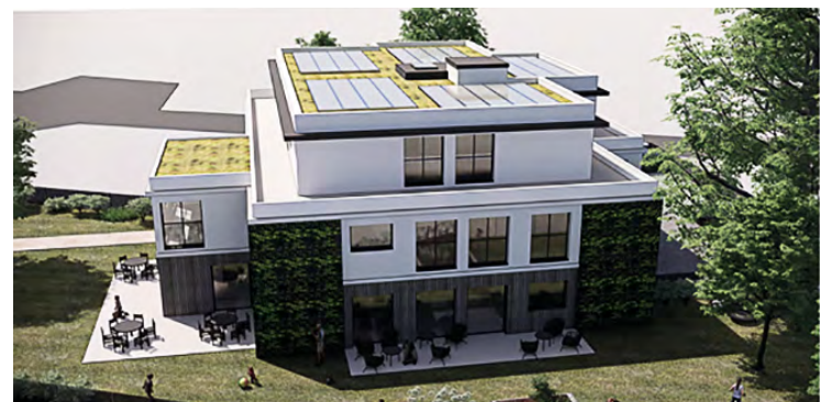
Le projet d'habitat intergénérationnel est construit dans une volonté de lutte contre l'isolement social.

Car la configuration même des espaces a été pensée pour que l'entraide et l'échange soient au rendez-vous.