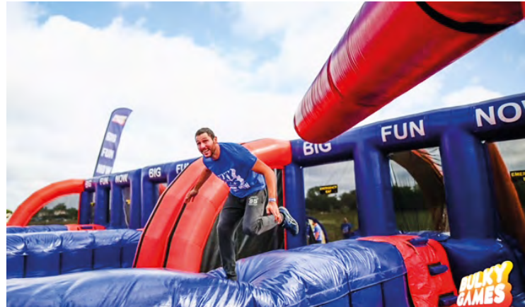
Les participants parcourent, en 1 h à 1 h 30, 4 à 5 km en franchissant 12 structures gonflables géantes.

Ce concept né en Belgique et développé dans plusieurs pays européens dont la France, s'installera pour la 1 re fois à SQY le 9 septembre. Il ne reste plus que quelques places.