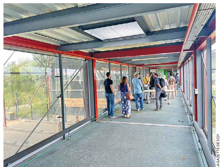
Une première phase « candidatures » de l'appel à projets se déroule jusqu'au 22 septembre et une première visite avait d'ailleurs eu lieu début juillet.

À l'issue de cette phase 2, l'EPA contractualisera avec les porteurs de projet afin de permettre leur installation dans les bâtiments à