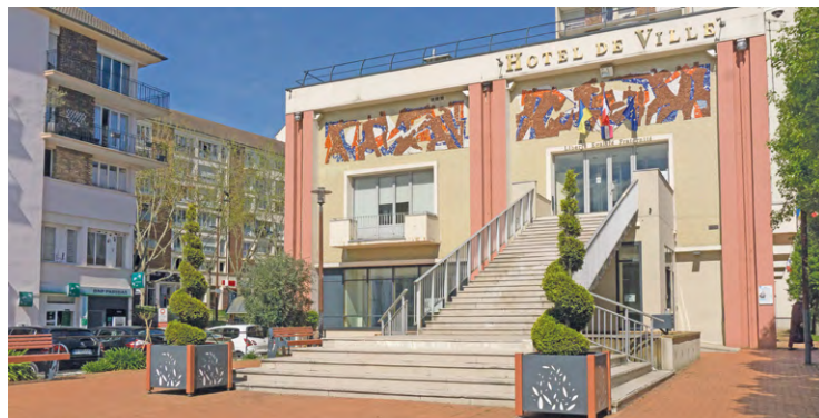
L'extension de l'aire de jeux du Bois de Nogent, la mise en place de poubelles intelligentes et la réhabilitation des terrains de basket au stade du Bois ont obtenu les faveurs des Maurepasiens.

Les habitants ont également adopté l'idée de poubelles intelligentes pour un budget de 13 000 euros, et voté pour la réhabilitation des terrains de basket au stade du Bois pour un montant de 3 000 euros. La municipalité de Maurepas avait