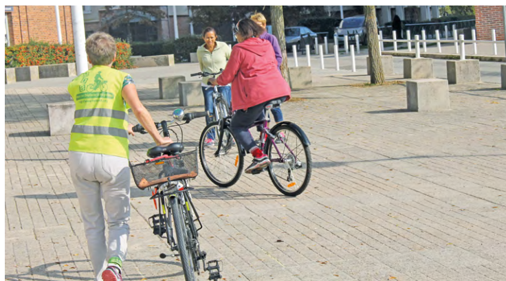
La Vie'cyclette œuvre dans trois domaines : l'aide à la réparation par des ateliers participatifs et solidaires, la récupération et la vente de vélos d'occasion, et des séances d'initiation au vélo pour les adultes.

Outre ses premiers locaux d'installation, dans le quartier verriérois du Bois de l'Étang, La Vie'cyclette a ensuite ouvert en juin 2022 des ateliers de réparation participatifs et solidaires à Montigny-le-Bretonneux et Trappes, puis un nouvel atelier, aux Clayes-sous-Bois cette fois, en juin dernier,