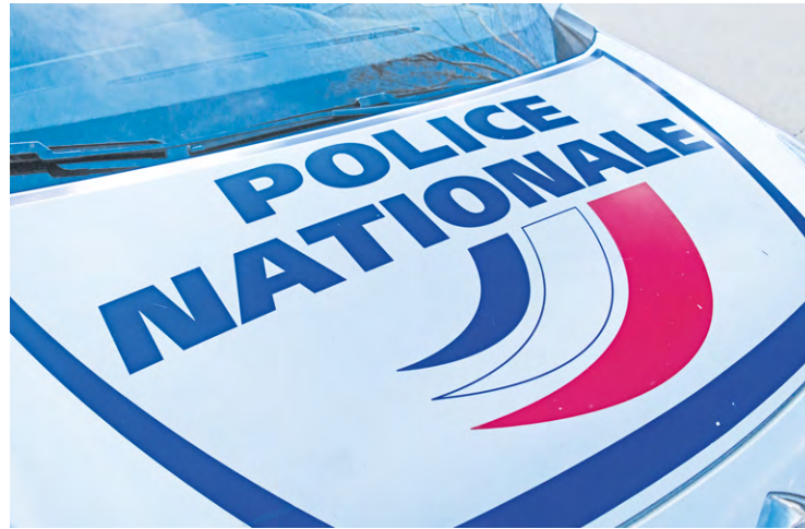
Les pillards de la concession motos Vmx installée dans le quartier du Valibout sont passés au tribunal. Certains ont été condamnés.

Le garage motos Vmx, installé dans le quartier du Valibout à Plaisir, a été pillé le 30 juin dernier durant les émeutes. Des vidéos circulant sur les réseaux sociaux ont permis d'identifier les auteurs.