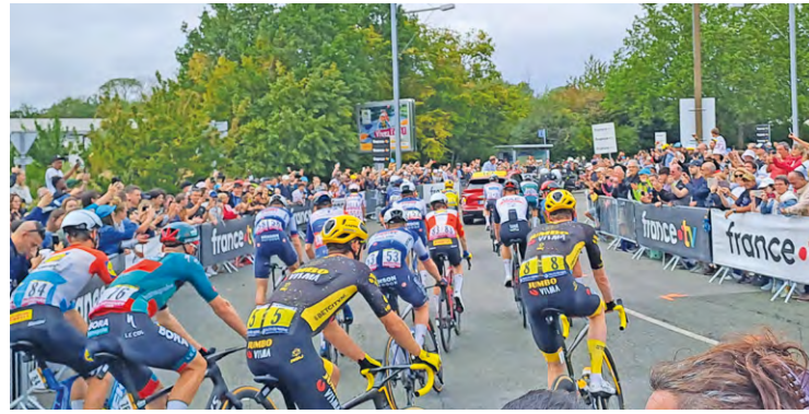
Après une présentation à l'intérieur du vélodrome, les coureurs ont emprunté la rue Laurent Fignon puis le rond-point de la Paix Céleste, avant de pédaler vers le reste de SQY, puis Paris.

La dernière étape, qui s'est élancée du Vélodrome national le 23 juillet dernier, et a passé environ 30 km dans l'agglomération, a connu un beau succès populaire.