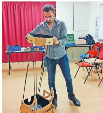
Voici un télescope Strock-250 mm de voyage, entièrement démontable pour être transporté en bagage cabine.