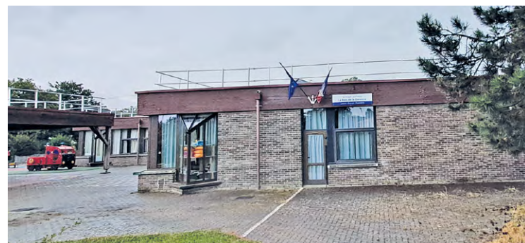
Un habitat pour seniors, une maison médicale-paramédicale ou encore du stationnement souterrain font partie des souhaits formulés par les Vicinois pour remplacer le groupe scolaire du Bois de la Garenne.