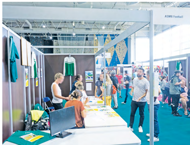
Le centre sportif Pierre de Coubertin accueillera de nouveau le forum des associations de Montigny-le-Bretonneux cette année. Il aura lieu le 9 septembre de 9 h à 17 h (ici, lors de l'édition 2022).

Moment incontournable de la vie associative et de planification des