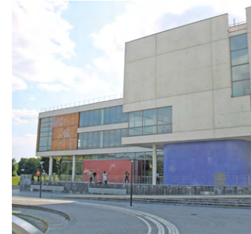
En 2023, Paris-Saclay se classe 15 e établissement d'enseignement supérieur mondial de l'ARWU, tandis que l'UVSQ en elle-même est 344 e mondiale du CWUR (sur 20 531 établissements).

Par ailleurs, sur les 20 000 universités et établissements d'enseignement supérieur dénombrés dans le monde, le Center for World University Rankings (CWUR) publie chaque année un classement international des 2 000 meilleurs d'entre eux. Cette année, l'UVSQ obtient le classement suivant : 344 e mondiale sur 20 531 établissements (soit une place dans le Top 1,7 % mondial), 19 e rang français et enfin 308 e rang mondial en recherche. Pour rappel, le CWUR est une agence de conseil