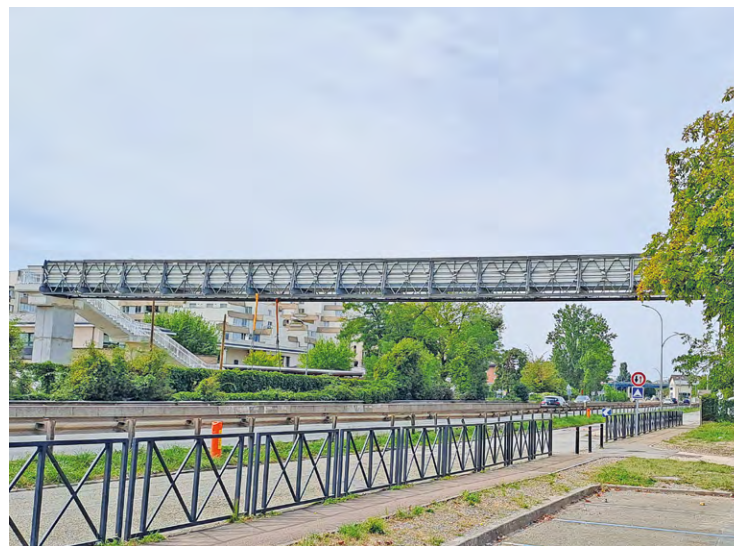
Cette passerelle temporaire a été installée par la Driat et permet aux piétons de franchir la RN10 en toute sécurité pendant la durée des travaux.

La municipalité de Trappes, souhaitant mettre la sécurité des habitants comme une priorité absolue, avait agi auprès de la DIRIF (Direction des routes d'Île-de-France), qui conduit les travaux, pour retarder au maximum cette échéance. Ainsi, une passerelle temporaire a été installée par les services de la Driat (Direction