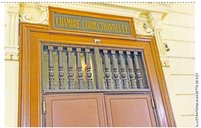
L'homme a été arrêté par les policiers de la Bac (Brigade anti-criminalité), deux jours après avoir commis son larcin.

Conduit au commissariat de Trappes pour y être placé en garde à vue, le mis en cause a été entendu. Il a reconnu avoir commis l'extorsion avec arme en justifiant son acte par une dette de 110 euros qu'il devait rembourser. En analysant son téléphone portable, les enquêteurs ont appris que l'homme avait cherché à se procurer une arme sur le réseau social Snapchat. Interrogé sur ce point, il est resté très évasif.