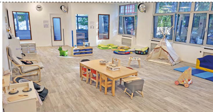
La grande salle d'activités de la micro-crèche Ritour'NEL propose de nombreux jeux pour les enfants.

Petite particularité sur le projet pédagogique, il y en a deux bien distincts pour les deux micro-crèches. « Sur la micro-crèche Polichi'NEL le projet pédagogique est la psychomotricité et à Ritour'NEL, il s'articule autour de l'éveil aux cinq sens. »