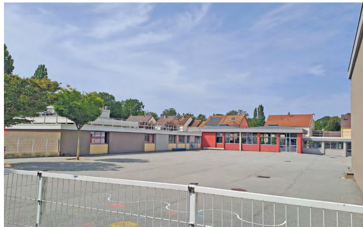
À la maternelle de La Marnière, la clôture, côté cour de la maternelle, devait être remplacée et rehaussée à 1,80 m, pour sécuriser la cour.

Ces travaux ont ainsi touché plusieurs établissements de la ville. C'est le cas de la maternelle de La Marnière où la clôture, côté cour de la maternelle, devait être remplacée et rehaussée à 1,80 m, pour sécuriser la cour. C'est également le cas de la maternelle Chapiteau où l'entrée de l'école devait être décalée pour sécuriser les entrées et sorties des enfants. Des travaux de menuiserie ont aussi été réalisés pour créer un nouveau bureau dont la vue donne sur l'entrée de l'école. Les travaux suivent