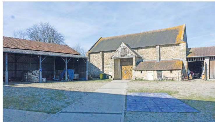
La ferme-école Graines d'avenir a accueilli l'équipe de tournage de Capitaine Marleau en juillet et août.

Un épisode de la série de France télévisions a été tourné à la ferme-école Graines d'avenir en juillet et en août.