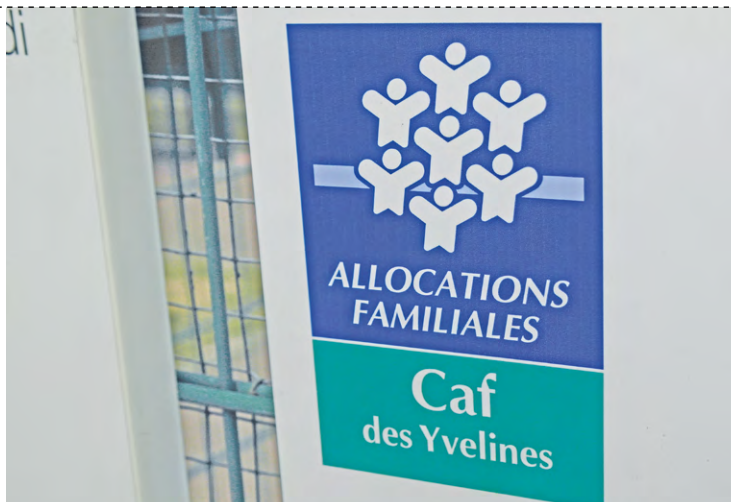
La CAF des Yvelines a versé 1,4 milliard d'euros au titre des prestations familiales et 161 millions d'euros de prestations sociales en 2022.

« Cette démarche vise à mettre les ressources de la CAF au service d'un projet de territoire afin de délivrer une offre de services complète, innovante et de qualité aux familles », précise la CAF dans son rapport. Sans oublier les autres services développés, comme l'offre d'accueil du jeune enfant, l'appel à projets Handicaf (pour appor-