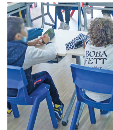
ILLUSTRATION/LAGAZETTE DE SOY

Une première expérimentation a été conduite auprès de 280 enfants en 2021 et 425 enfants en 2022 sur les territoires de Plaisir et Trappes afin de démontrer la faisabilité du programme. Pour poursuivre et amplifier cette action en priorité à destination des quartiers prioritaires, le Département vient d'approuver l'accompagnement de 900 enfants issus de familles vulnérables, repérées par les professionnels de la PMI, notamment par la réalisation d'ateliers