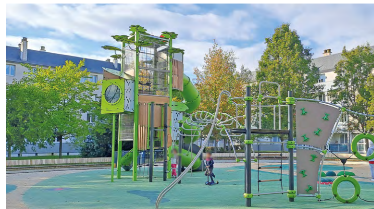
Selon le maire, il y avait « un risque de fermeture de services de proximité, [...] de surloyer, d'augmentation des charges » et bien d'autres pertes en cas de sortie du dispositif QPV.

Et les raisons invoquées par l'État pour prendre cette décision ne semblaient absolument pas justifiées aux yeux de l'édile de La Verrière. « Pour se justifier, l'État se fonde uniquement sur les revenus par habitant, sans tenir compte de la réalité de terrain que nous vivons au quotidien : augmentation des charges, davantage de familles monoparentales qui peinent à joindre les deux bouts, des emplois toujours plus précaires. Le nombre de salariés occupant un emploi précaire a été multiplié par quatre en quatre ans à Orly Parc », a ajouté le maire dans son intervention.