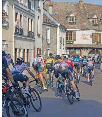
Après un départ du Vélodrome national, plusieurs communes de SQY, dont Villepreux (ici lors du Tour 2020), seront traversées par la dernière étape de cette 110 e édition.

Les Clayes, justement, qui accueillera donc aussi le Tour, avec un passage aux alentours de 16 h 45 avenue Barbusse, rue Massenet, chemin des Vignes, avenue Ferry et rue Prou. Le stationnement sera interdit sur ces tronçons du 22 juillet à 18 h au 23 juillet à 18 h. La circulation sera elle interdite seulement le 23 juillet,