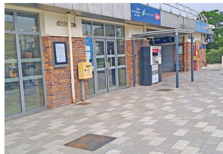
Comme tous les chantiers, celui-ci aura son lot de nuisances, d'autant que les travaux auront lieu essentiellement la nuit et certains week-ends pour limiter les perturbations sur les lignes desservant la gare.

Depuis quelques années, ce sont toutes les gares de Saint-Quentin-en-Yvelines qui font l'objet de travaux de modernisation ou de projets de réaménagement complet. Ainsi, le chantier de la gare de Montigny-le-Bretonneux / Saint-Quentin-en-