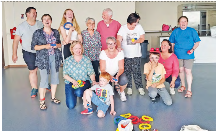
14 personnes ont participé à la séance. Certaines étaient déjà venues, quand d'autres ont découvert l'activité, qui a fait l'unanimité d'après les sourires radieux sur les visages.

Depuis, elle propose des ateliers collectifs et individuels pour tout le monde. Car le Brain ball, ou la gymnastique du cerveau, est une activité intergénérationnelle qui permet de rassembler des enfants, (à partir de sept ans) des adultes et des seniors. « J'ai par exemple dans un de mes cours, un monsieur âgé de 99 ans précisément qui est encore très dynamique. Cela fait plaisir à voir », se réjouit Nathalie.