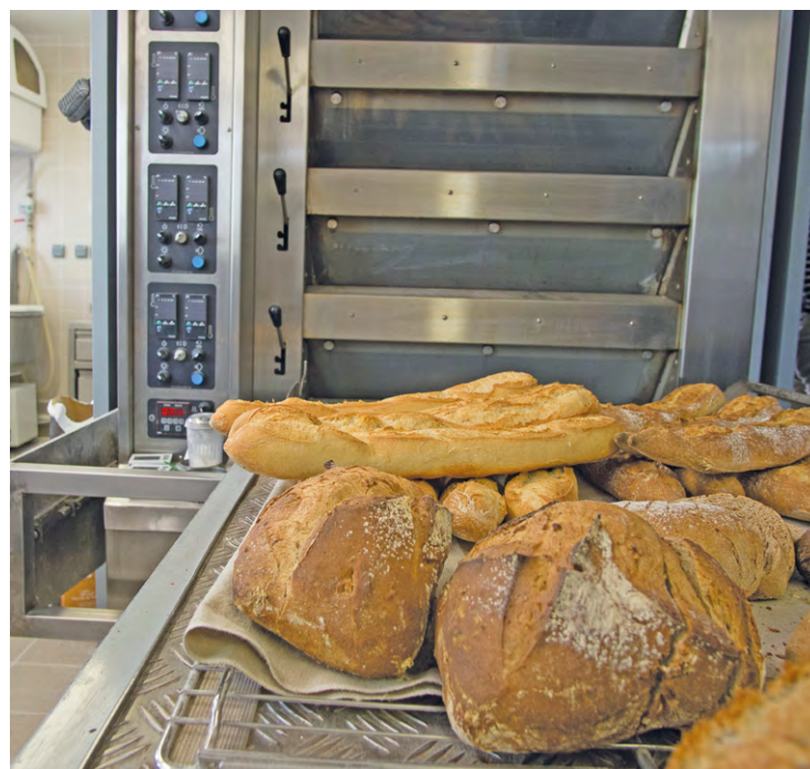
Deux hommes se sont introduits dans une boulangerie la nuit pour dérober la caisse. L'un des deux a été arrêté.

En essayant de voler la caisse, les deux voleurs sont pris en flagrant