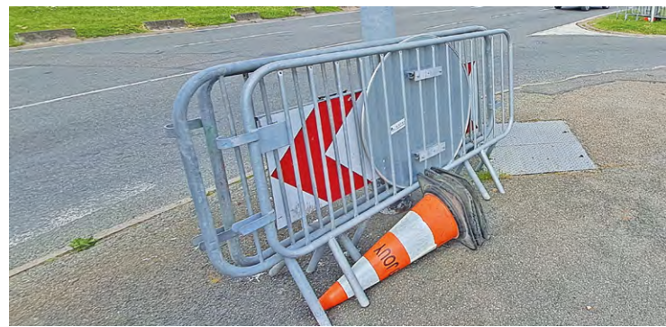
ILLUSTRATION/LAGAZETTE DE SOY

Sont aussi prévus des travaux d'enfouissement de réseaux et de rénovation du réseau d'éclairage public,