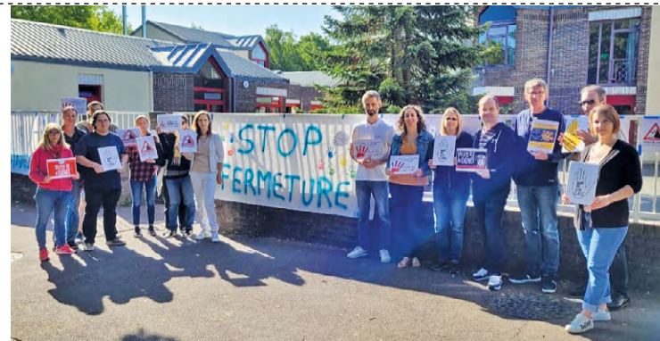
Les parents réclament le maintien de la 8 e classe, dont l'Éducation nationale a annoncé la fermeture le 29 juin selon eux.

Avec cette fermeture, la crainte des sureffectifs se précise. Emmanuel Macron avait annoncé en 2019 des classes à maximum 24 élèves en