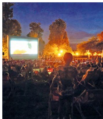
À Élancourt, Guyancourt, La Verrière, Plaisir, Trappes et Villepreux, le public pourra venir regarder des films en plein air, à la tombée de la nuit.

Plusieurs séances sous les étoiles sont organisées cet été dans l'agglomération. Tour d'horizon des six villes accueillant ce type de projections.