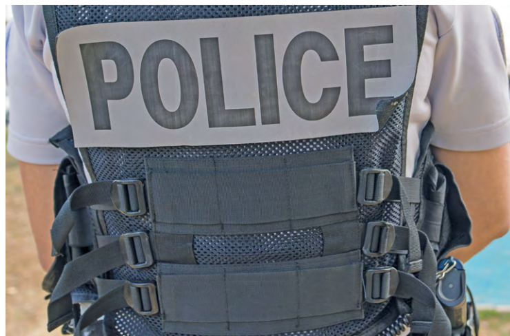
Des policiers se sont rendus dans un appartement situé avenue de l'Image Notre-Dame à Villepreux pour une violente bagarre, durant laquelle un homme a arraché avec les dents le doigt de son adversaire.

Une effroyable scène s'est déroulée à Villepreux. Deux hommes qui se sont battus pour une histoire d'argent ont fini au tribunal. L'un a mordu l'autre à la main jusqu'à lui arracher le doigt avec les dents.