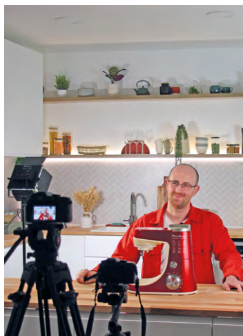
L'entreprise SOS Accessoire s'est dotée d'un nouveau studio vidéo. Sa chaîne YouTube possède plus de 65 000 abonnés.

« SOS Accessoire a également revu la tenue du présentateur des tutos en optant pour un bleu de travail moderne aux couleurs de la marque,