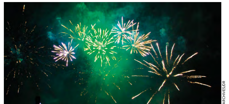
À Élancourt (ici il y a deux ans), le feu d'artifice sera tiré le 13 juillet à 23 h sur la coulée verte de la Commanderie. Quatre autres villes de SQY proposeront des feux d'artifice à cette date.

Comme tous les ans, le feu d'artifice sera tiré le 13 juillet à 23 h au-dessus du bassin de la Sourderie, en collaboration entre les villes de Montigny et Voisins-le-Bretonneux. Avant cela, le groupe musical Wanted se produira dès 21 h 30 lors d'un bal populaire « pour vous faire danser avant et après le feu d'artifice », indique le journal