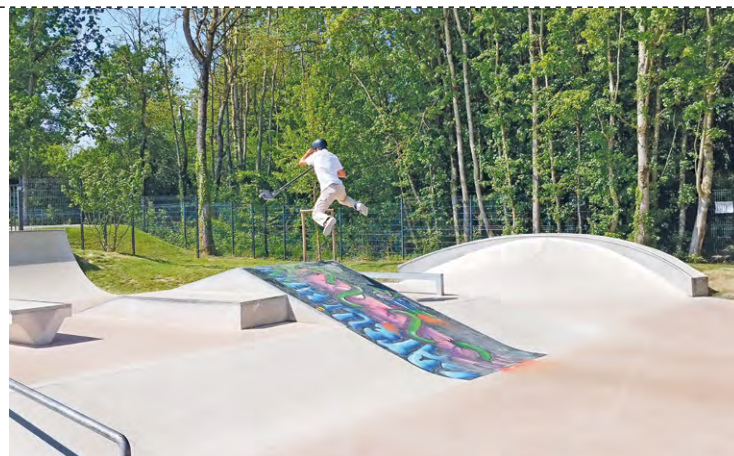
Des démonstrations de freestyle en trottinette et skateboard ont ravi les spectateurs.