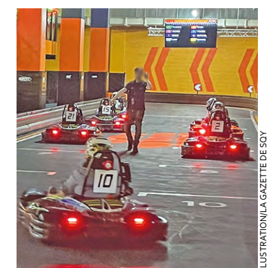
Près de 200 participants, répartis par équipes de trois, sont attendus sur le circuit Jean-Pierre Beltoise.

Ainsi, sur la piste de deux kilomètres portant le nom de l'illustre pilote automobile français décédé en 2015, sont attendus près de 200 participants, répartis par équipes de trois, « pour une compétition conviviale », affirme l'Agglomération. Un tel rendez-vous vise ainsi à « favoriser la rencontre entre les entreprises et les étudiants, entre recruteurs et futurs salariés, pour booster la dynamique emploi et créer de la synergie positive entre tous », ajoute SQY.