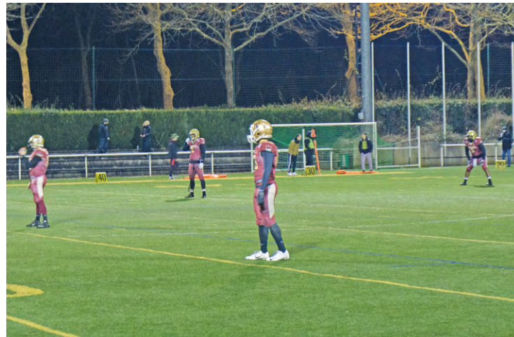
Les Templiers (ici l'équipe une dans son championnat de D2) sont un peu représentés au sein de la ligue européenne professionnelle de football américain.

Trois joueurs passés par le club élancourtois participent à l'European league of football, dont deux avec les Mousquetaires, la 1 re franchise professionnelle de football américain en France.