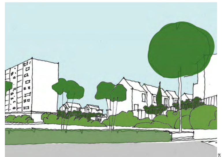
Le projet devrait s'étaler jusqu'en 2027-2028.

« Nous créons des espaces verts et des lieux où les familles vont pouvoir se retrouver dans un square ou un parc qui sont aujourd'hui de vrais îlots de fraîcheur », souligne l'élu, avant de conclure : « Par ailleurs, il y a un gros travail des bailleurs pour retravailler les appartements : pièces humides, changement de fenêtres, les cages d'escalier, etc. C'est un projet énorme, qui a demandé du temps à se mettre en place. Le projet va désormais s'accélérer. 1001 vies habitat