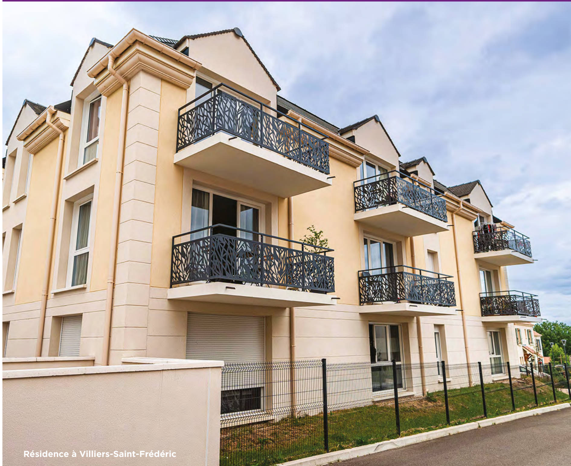
Résidence à Villiers-Saint-Frédéric