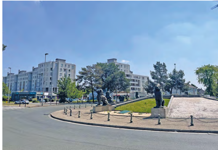
Pas moins de 50 millions d'euros vont être investis dans le quartier des Petits Prés.

En matière de répartition, le département des Yvelines va investir quasiment 23 millions d'euros. Pour sa part, l'agglomération de Saint-Quentin-en-Yvelines, dont fait partie Élancourt, va prendre à sa charge pas moins de 5 millions d'euros. De son côté, la commune d'Élancourt ne sera pas en reste puisqu'elle va mettre quasiment six millions d'euros dans l'opération, notamment parce que la Ville va devoir démolir et reconstruire une école. Enfin, et ils jouent leur rôle, les deux bailleurs sociaux font aussi partie du tour de table financier : Seqens va mettre plus de 10,5 millions d'euros et 1001 vies habitat mettra un peu plus de 3 millions d'euros.