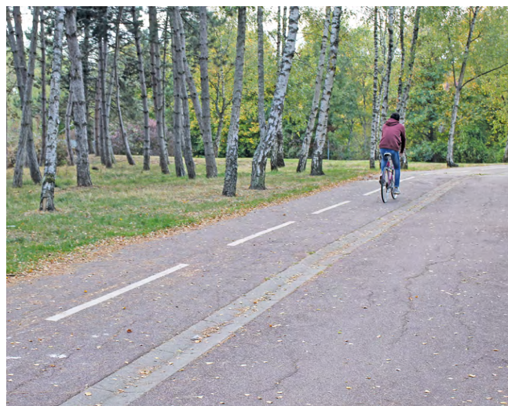
ILLUSTRATION LA GAZETTE DE SOY

Des animations sont prévues le 17 juin à l'occasion du GuyanTour, permettant d'effectuer un tour de la commune à vélo ou trottinette, en attendant le passage du Tour de France dans la ville le 23 juillet.