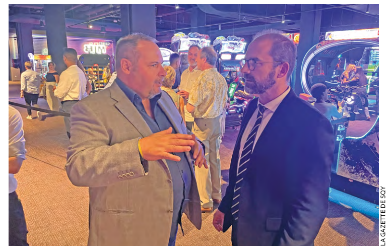
« Vous avez relevé le défi et vous avez su trouver les bons acteurs pour mettre en place ce projet », a déclaré le maire de Montigny (à droite sur la photo) au propriétaire, la Société des grands magasins.