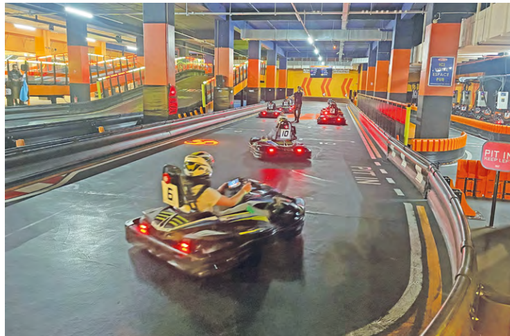
Speed park vient de se payer le luxe d'offrir aux amateurs de vitesse la possibilité de s'affronter au volant de kartings sur une piste de 230 m en plein cœur des allées de SQY Ouest.

C'est une première en France pour la société Speed park. Pour sa 18 e ouverture dans l'Hexagone, elle vient de se payer le luxe d'offrir aux amateurs de vitesse, pilotes chevronnés ou débutants, la possibilité de s'affronter au volant de kartings, désormais entièrement électriques, sur une piste de 230 m en plein cœur des allées du centre commercial SQY Ouest, à Montigny-le-Bretonneux.