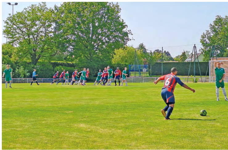
Lors de l'avant-dernière journée, les Maurepasiens (en vert) s'étaient largement imposés face à Villeparisis (photo). Mais après leur déroute au Perreux (4-1) le 4 juin, ils sont condamnés à la relégation.

Les Maurepasiens n'ont pas fait le poids chez le leader, Le Perreux (défaite 4-1), le 4 juin lors de la dernière journée. Ils sont donc relégués en Départemental 1.