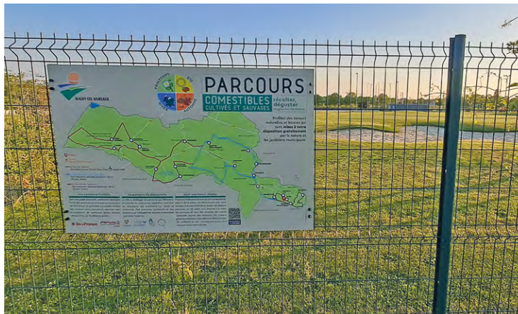
Les parcours comestibles sont jalonnés de panneaux pédagogiques qui vous invitent à la découverte des différents lieux de la ville et à la gourmandise.

Ces parcours passent par différents lieux publics de la ville de Magny-les-Hameaux et, ainsi, vous pourrez découvrir et disposer de différentes ressources comestibles : fruits de différents arbres et arbustes fruitiers et plantes comestibles telles que feuilles, fleurs, baies... Sur ces différents parcours mis à votre disposition, vous pourrez également découvrir des lieux emblématiques de Magny-les-Hameaux, connus pour abriter des arbres remar-