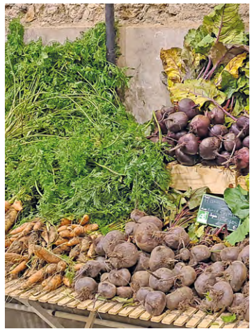
L'objectif de ces Assises était de réviser la politique agricole du territoire et de se doter de nouvelles orientations en la matière dès 2023.

« Avec les Assises de l'alimentation, nous avons souhaité agir avec des mesures concrètes en faveur du bien-manger. Nous sommes en train de définir une véritable politique alimentaire