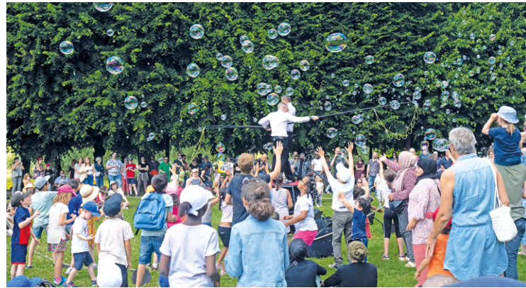
Le public de tous âges pourra venir profiter des déambulations, concerts, jeux, spectacles de danse, représentations circassiennes, expositions ou encore stands de restauration.

La 19 e édition du festival se tiendra le 10 juin dans le parc du château. Au programme, comme chaque année, déambulations, musique, jeux, ateliers et bien d'autres animations.