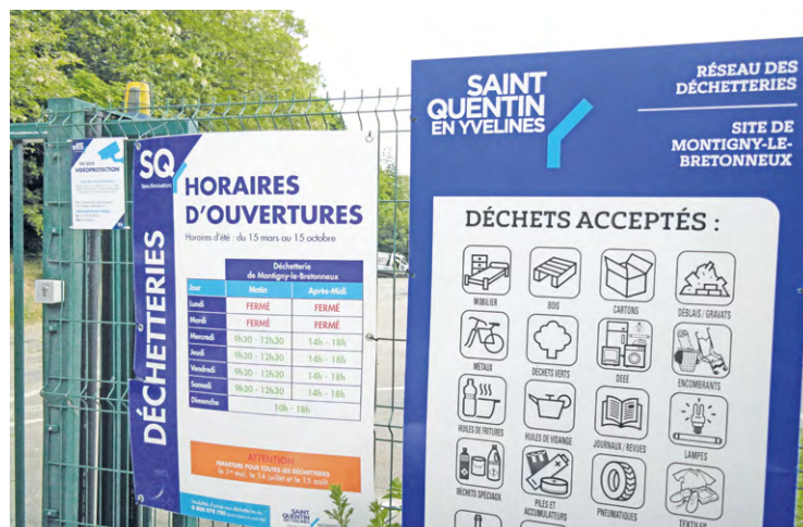
Six des déchetteries de l'agglomération acceptent et assurent la collecte des pneus usagés.

Les pneus se recyclent désormais dans six des déchetteries de l'agglomération.