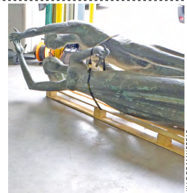
La Danse mesure 3 m de haut et est construite en métal.