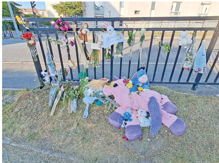
C'est dans la rue Fernand Bréan, à Trappes, que l'accident s'est produit. Des fleurs et des mots de soutien ont été déposés par des Trappistes.

Une jeune conductrice, âgée de 21 ans, en permis probatoire et positive au cannabis, a tué une petite fille de six ans dans la soirée du mardi 23 mai.