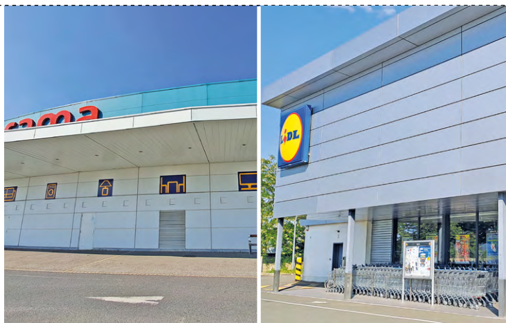
L'Intermarché devait voir le jour aux Portes de Chevreuse (à gauche), tandis que de l'autre côté de la N10, le Lidl va s'étendre et occuper l'ex-riche Lada.

Le lieu, qui a aussi connu une occupation des gens du voyage, est donc toujours en friche, et ce depuis trois ans. L'une des rares friches encore présentes dans la commune. « On a un pourcentage de friches commerciales ou industrielles qui est faible,