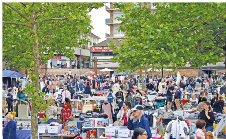
Les prochains vide-greniers attendent les Saint-Quentinois ces prochains mois dans les villes de Coignièrès, Maurepas et plus tard à Plaisir.

La période des vide-greniers est relancée et vous pouvez en profiter dès maintenant à Coignièrès et Maurepas.