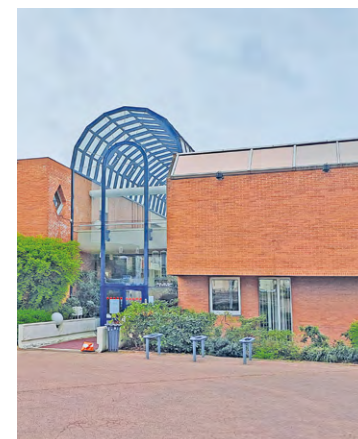
Au programme de cette semaine, conférences, animations ludiques, visites guidées, expositions, chasse au trésor ou encore conseils pratiques.

Au programme de cette semaine dédiée au développement durable, des conférences avec des chercheurs et pédagogues de renom, des animations ludiques, pour sensibiliser les plus jeunes avec la collaboration de plusieurs associations partenaires, des visites guidées et des expositions, pour découvrir, à Villepreux, certains sites et équipements hydrauliques d'hier et d'aujourd'hui, une chasse au trésor pour inviter toutes les familles à découvrir, à leur rythme, au fil