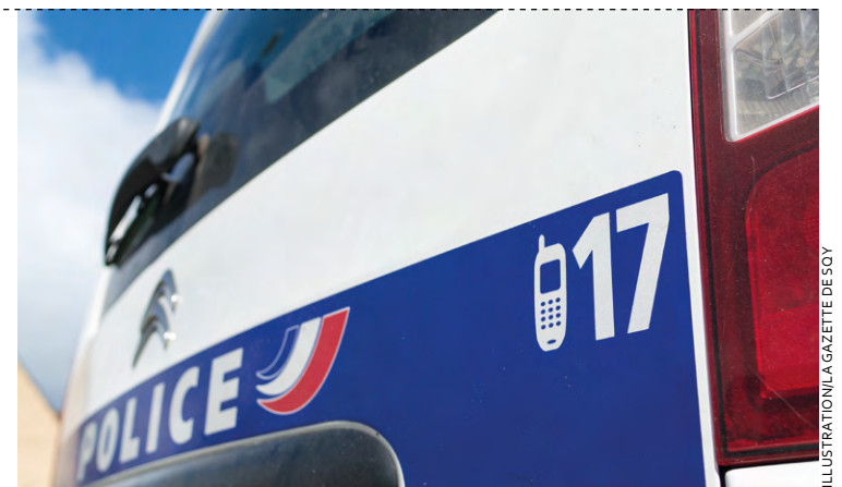
Les policiers ont arrêté deux hommes. L'un avait braqué le restaurant McDonald's de Maurepas tandis que son complice était chargé de faire le guet.

Lors de leurs auditions, les deux hommes ont reconnu les faits. Celui qui a pénétré dans le restaurant a déclaré s'être fait remettre la caisse pour un montant total de 302 euros. La somme a