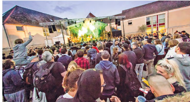
Au programme, deux jours « sous une ambiance festive et décontractée », avec « des concerts, un village associatif et des animations à couper le souffle », indique le site internet du festival.

La 5 e édition de ce festival de musique se tient les 2 et 3 juin à l'extérieur de l'espace Decauville. Au programme, 12 artistes et/ou groupes, sur deux scènes et 14 heures de concert.