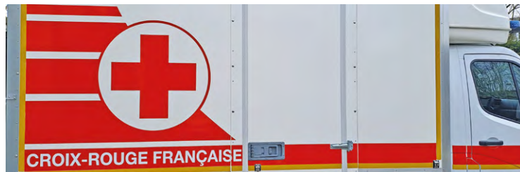
Chacun peut également donner de son temps pour ce grand rendez-vous, en venant aider la Croix-Rouge à collecter en devenant « bénévole d'un jour ».

Dans un contexte économique et social défavorable pour les plus vulnérables, la Croix-Rouge constate une augmentation de 22 % du nombre de personnes accueillies. « Cette évolution, par rapport à l'année précédente, touche particulièrement les enfants de moins de 15 ans (19 %) et les jeunes de 15 à 25 ans (27 %). À cette situation alarmante viennent s'ajouter les difficultés rencontrées par ses centres de distribution à se fournir en denrées ali-