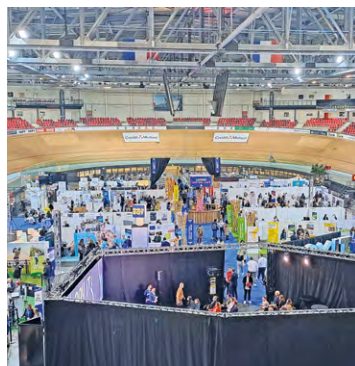
10 000 offres d'emploi étaient à pourvoir lors de cet événement où étaient notamment présentes les plus grandes entreprises du territoire.

10 000 offres d'emploi étaient à pourvoir lors de ces deux jours, et 800 entreprises du territoire étaient présentes, dans des domaines divers, même si « SOY est quand même très