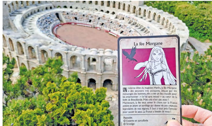
Les visiteurs utilisent des cartes les envoyant devant certaines maquettes de monuments, et doivent résoudre différentes sortes d'énigmes.

Dans La France des légendes, proposée depuis cette année, les visiteurs doivent déjouer le sortilège de la fée Morgane en résolvant des énigmes dans tout le parc à l'aide de cartes et de QR codes.