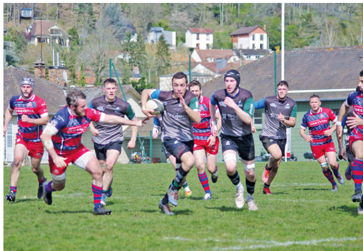
Les joueurs de l'URC78 sont ici en possession du ballon, mais c'est bien Chevreuse qui s'est qualifié pour les demi-finales en l'emportant (32-20).

Le club saint-quentinois s'est incliné en quart de finale de Régionale 1 le 16 avril dernier sur le terrain de Chevreuse (32-20), et s'arrête donc à ce stade de la compétition.