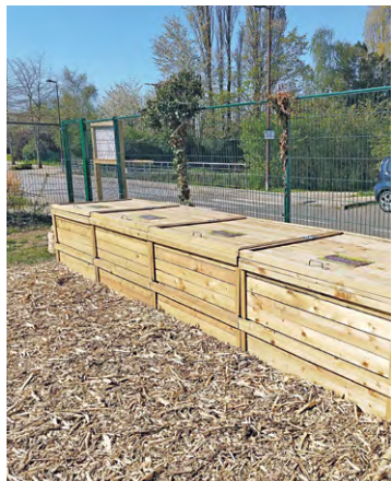
Le composteur collectif du jardin partagé du Pont du Routoir permet aux habitants de réduire le volume de leur poubelle en collaborant à une action écologique et participative.

Le second composteur collectif de Guyancourt a été installé, en mars dernier, dans le jardin partagé du Pont du Routoir. « C'est le deuxième composteur installé sur la commune, il y en avait déjà un dans le jardin par-