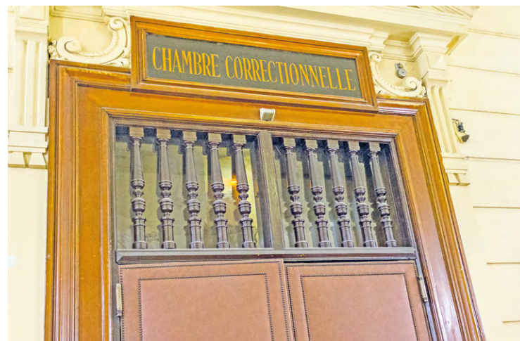
Le tribunal judiciaire de Versailles a condamné une femme pour des violences commises entre février et avril 2023 sur sa compagne, chez qui elle vivait.

Une femme a été condamnée par le tribunal judiciaire de Versailles le 21 avril pour des violences commises sur sa compagne, chez qui elle était hébergée.