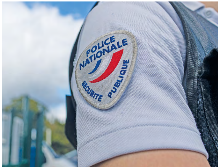
Une femme de 50 ans a été arrêtée par la police à Élancourt car elle violentait sévèrement sa fille.

Une mère de famille arrêtée à Élancourt car elle faisait vivre un enfer à sa propre fille, entre insultes, coups et usurpation d'identité.