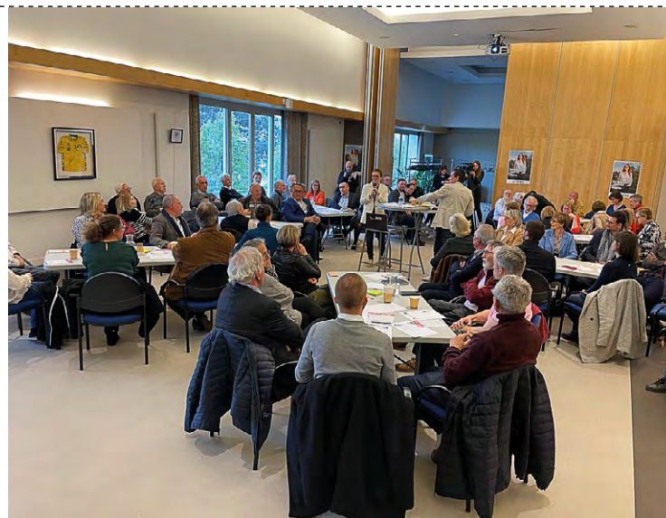
Une centaine de personnes ont répondu à l'appel d'Aurore Bergé pour participer à son premier débat de l'Agora citoyenne.

Trois rendez-vous donc, dont le premier s'est déroulé jeudi soir dernier en mairie de Maurepas, avec pour thème la santé et l'autonomie. Plus d'une centaine de personnes avaient répondu à l'invitation de la députée, dont des élus et maires, la directrice de l'hôpital de Rambouillet, le directeur départemental de l'Agence régionale de santé, des professionnels de santé et des habitants de la 10 e circonscription des Yvelines. Dans la salle, un policier pari-