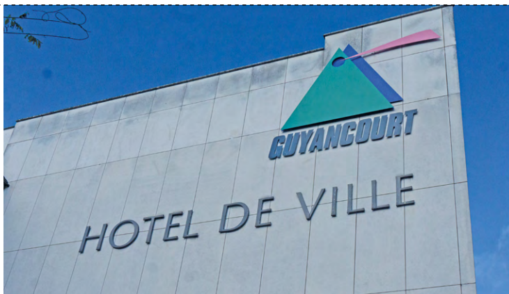
L'adjointe aux finances a également rappelé que si, depuis le 1 er janvier 2023, la Ville avait la possibilité de faire évoluer le taux de la taxe d'habitation sur les résidences secondaires, elle a « décidé de ne pas le faire ».