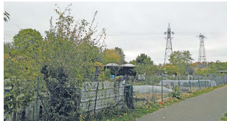
Le devenir des jardins familiaux et l'enfouissement des lignes à haute tension font partie des grandes questions liées au projet.