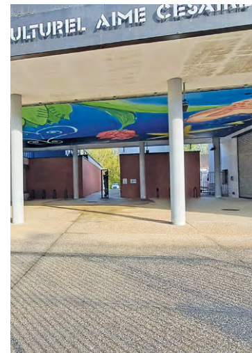
Cette visite est organisée par la Maison des Initiatives et des réussites (Mire) de La Verrière, située au sein de l'espace Aimé Césaire.

Durant 8 mois environ, le jeune suit un programme intensif, du lundi au vendredi. Il bénéficie également d'une préparation au permis de conduire, de sport pour retrouver son équilibre, d'actions de solidarité, d'activités culturelles et de loisirs. Les jeunes peuvent également être accompagnés d'un conseiller en insertion professionnelle pour