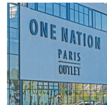
Le centre commercial One nation est un centre outlet regroupant plus de 400 marques avec des réductions toute l'année d'au moins 30 % sur les collections de la saison précédente.

C'est pour satisfaire ces derniers que Jack and Jones, une marque danoise de vêtements pour homme, et Outly, la première chaîne européenne de magasin d'optique en outlet, ont ouvert leurs portes au niveau 0, au sein du patio Place de l'Étoile, respectivement les 5 et 15 avril. Par