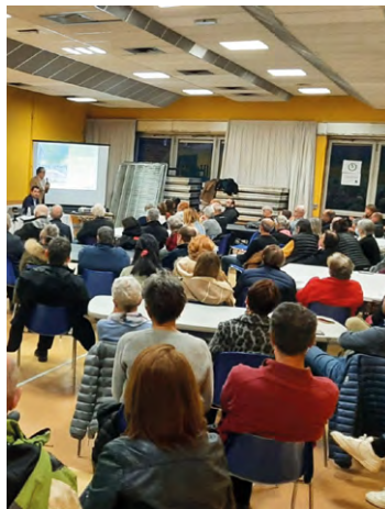
Plus d'une centaine de personnes ont assisté à la réunion publique consacrée à l'avenir de la place Jacques Cœur.

Reconstruire sur le bâti existant ne semble pas être possible, comme l'expliquait l'urbaniste présent à la réunion. L'organisation même de la place est un handicap pour un projet ambitieux. « Nous avons des implantations de bâtiments sur la parcelle qui font que vous arrivez d'abord sur un parking, a regretté le maire. Est-ce que l'on ne préfère pas avoir du front bâti et avoir un parking derrière ? Est-ce qu'à la place de la maison de quartier on ne mettrait pas un espace vert en lien avec Descartes et que la maison de quar-