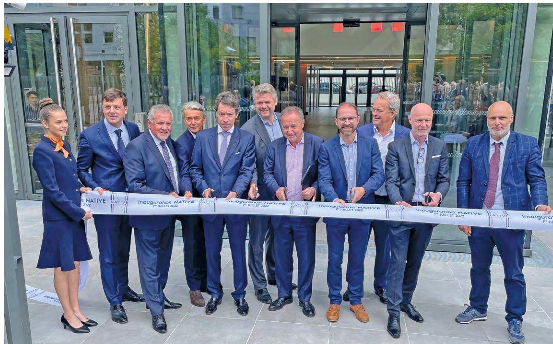
Le dernier né de l'Hypercentre (Montigny-le-Bretonneux) a été inauguré vendredi 1 er juillet 2022.

« Les élus s'inscrivent dans le temps long et je veux ici remercier Michel Laugier (sénateur DVD, ancien maire de Montigny-le-Bretonneux et ex-président de SQY, ndlr) d'avoir lancé cette réflexion, d'avoir eu cette vision. Tout ce quartier, essentiel à SQY et à Montigny-le-Bretonneux, fait l'objet d'un travail d'ensemble de l'Agglomération. »