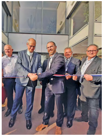
La MSPU Jacques-Prévert a été inaugurée à la mi-juin.

nels de santé, investis dans les soins, l'enseignement et la recherche. Un certain nombre de ces professionnels exerçait déjà à Saint-Quentin-en-Yvelines. D'autres sont amenés à les rejoindre au fur et à mesure du fonctionnement normal de la MSU.