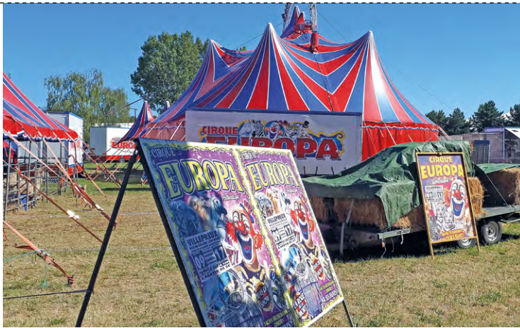
La Ville dénonce un « procédé malhonnête » d'implantation du cirque Europa sur une parcelle privée, dont le propriétaire aurait été trompé par le directeur du cirque sur la nature des spectacles.

« Il y a également une certaine négligence de la part du propriétaire, qui n'a pas pris le soin de vérifier la position de la municipalité quant à l'implantation d'un cirque sur la commune, estime-t-il. Néanmoins, ce propriétaire a été berné par le directeur du cirque, qui lui