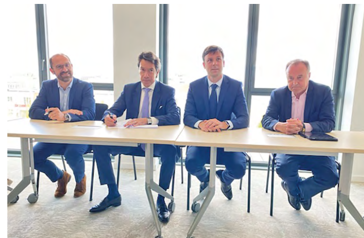
L'agglomération de SQY, la Ville de Montigny et Codic ont officialisé la transformation de l'Anneau rouge (gare de SQY).

Et effectivement, Native ressort pleinement dans son nouvel environnement. « Native est le symbole de