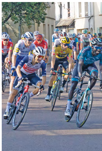
Villepreux (ici en 2020) aura de nouveau l'honneur d'être traversée par le peloton du Tour de France, ce qui devient une habitude pour la commune ces dernières années.

Villepreux, quasiment abonnée à la Grande boucle ces dernières années puisqu'elle a déjà vu passer le Tour sur son territoire en 2018 et 2020, sera de nouveau traversée par le peloton, qui arrivera par la route de Rennemoulin puis se dirigera vers la côte de Paris. Arrivée de la caravane prévue vers 15 h 22, et des coureurs à partir de 17 h 19. À cette occasion, fermeture de la D 161 direction Rennemoulin, de la côte de Paris, et de la D 11 vers Fontenay. Le peloton pas-