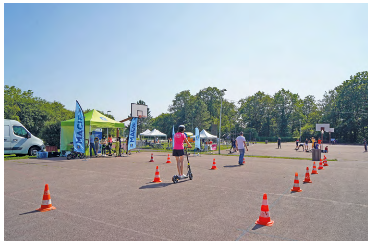
À Maurepas, Le Village Esti'Jeunes sera de nouveau à l'affiche cet été, du 12 juillet au 19 août au stade du Bois.

Après les contraintes sanitaires, qui ont conduit à revoir certaines programmations ces deux dernières années, les opérations d'été reviennent en force dans les communes de SQY.