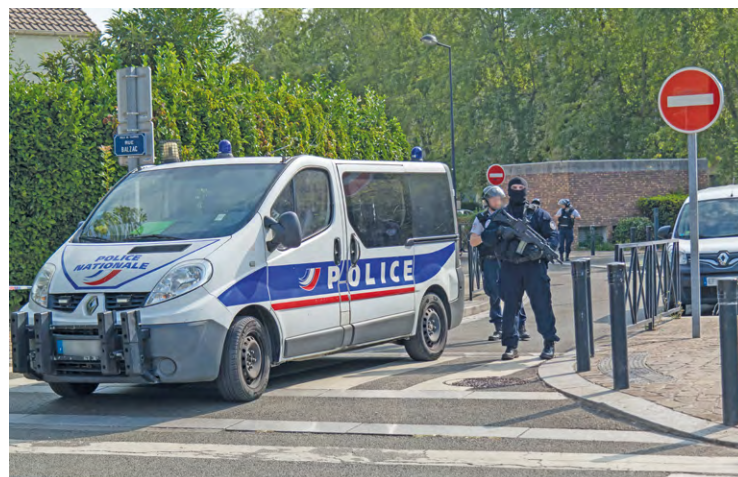
La police judiciaire a été saisie à la suite d'une attaque mortelle au couteau qui a eu lieu dans le parc des Bateleurs.

Un Trappiste de 65 ans qui se promenait au parc des Bateleurs a reçu plusieurs coups de couteau. Il n'a pas survécu à ses blessures.