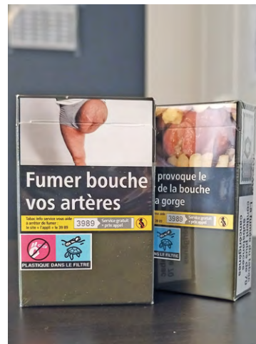
50 cartouches de cigarettes et près de 10 grammes de cocaïne retrouvés dans la voiture du revendeur.

L'individu, âgé de 29 ans, a été présenté à un officier de police judiciaire du service départemental de nuit, pour être placé en garde à vue. La fouille de la voiture a révélé la