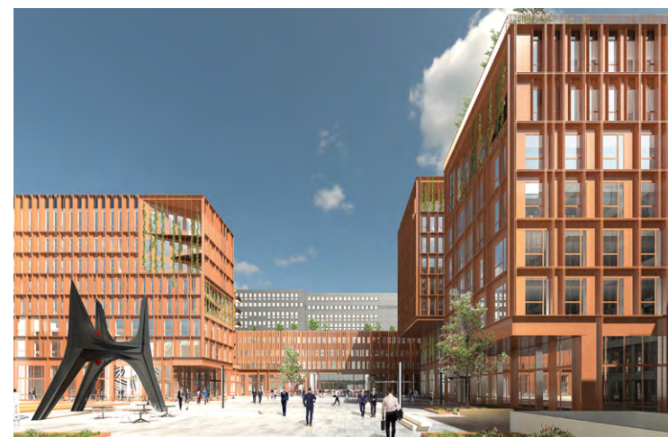
La perspective de Centralité des futurs bâtiments qui vont remplacer l'Anneau rouge.