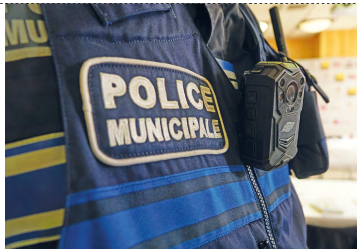
Le CISPD aura pour mission « d'animer la stratégie territoriale de sécurité et de prévention de la délinquance mutualisée », indique la Ville des Clayes-sous-Bois sur sa page Facebook.

« Cette volonté de mutualiser est née du constat d'enjeux de prévention de la délinquance et de sécurité semblables